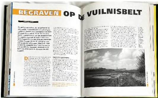
De Begraafplaats - september 2004

Bij het woord 'vuilnis' moet ik altijd aan onze onvolprezen (en inmiddels al jaren geleden overleden) hulp Marietje denken. Zij poetste bij ons als Rindert en ik naar ons werk waren. Goud waard, zo'n hulp. Ze had de sleutel, was 100% betrouwbaar en kon poetsen als de beste. Veel beter dan ik.