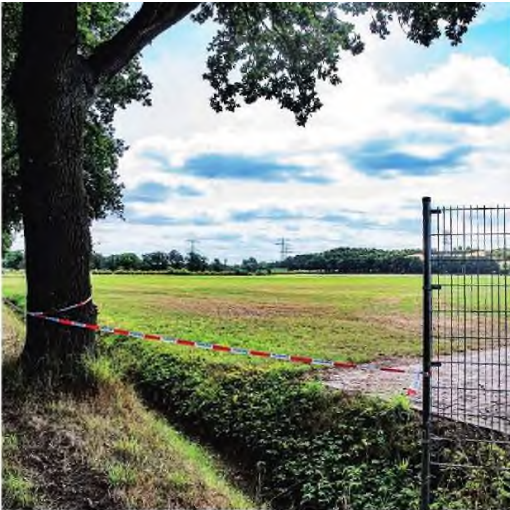
▲ Het noordelijke deel van Landgoed Gulbergen. In de verte is de bult van de voormalige vuilstort zichtbaar.