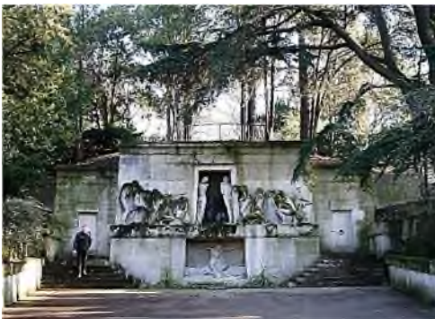
Cimetière de Père Lachaise

Parijs is en blijft een verrukkelijke stad. Recht tegenover het Gare du Nord was ons hotel te vinden. Dat was een makkie: trein uit, straat oversteken, hotel in. Zoals meestal rondom elk station was het ook daar een drukte van belang. 's Avonds zou dat nog erger worden. En wat je dan allemaal ziet vanachter het raam van een restaurantje. Amsterdam is daar maar een provinciestadje bij.