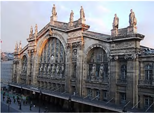
Gare du Nord