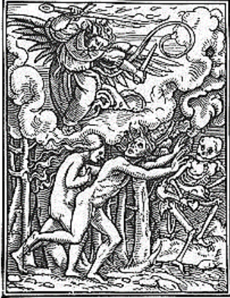
Hans Holbein: de verdrijving uit het paradijs en het verlies van de onsterfelijkheid

Vooralsnog lijkt mij dat de ultieme onsterfelijkheid: op internet blijven plakken. Het geloof dat iedereen toch ooit zal zien wat je erop dumpt is immers allang een nieuwe religie. Computer en internet zijn heilig. Zonder dat is de wereld niet meer voor te stellen. Onsterfelijk.