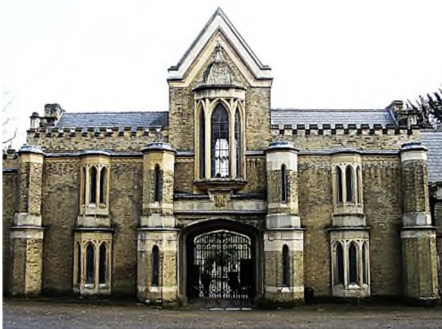
poort Highgate Cemetery - West