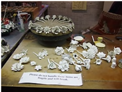
Stoke-on-Trent - Gladstone