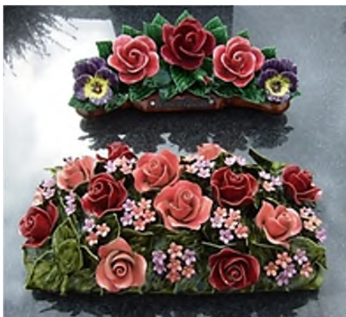
Calais - Cimetière Nord

Twee grote hobby's heb ik. En nog een heleboel kleintjes. Nummer 1 is het maken van keramiek. En nummer 2 het bezoeken (en fotograferen) van begraafplaatsen. En die twee komen geregeld samen.