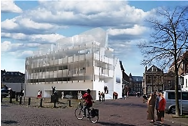
ontwerp glazen huis in Kampen