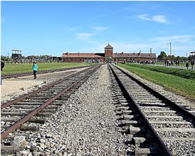
Auschwitz - Birkenau