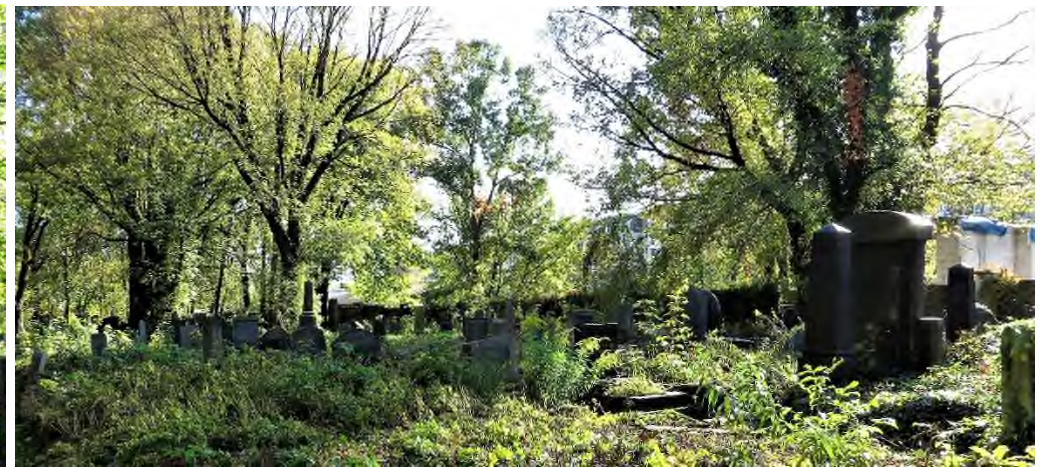
Krakau - Kazimierz: nieuwe joodse begraafplaats