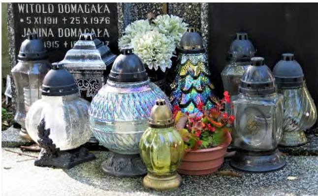
Krakow - Cmentarz Rakowicki