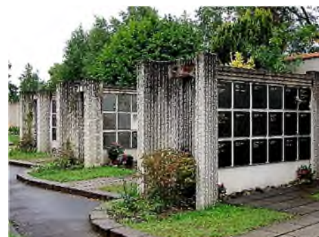
Amiens : crematorium & columbarium 'jardin du souvenir'