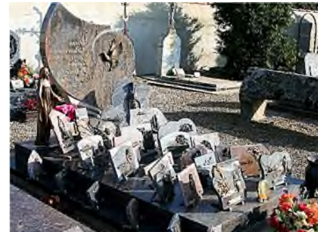
plaquettes op de graven / des plaques sur les sépultures