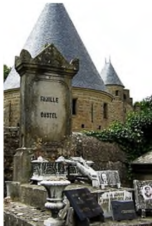
begraafplaatsen in Frankrijk / cimetières en France Languedoc-Carcassonne