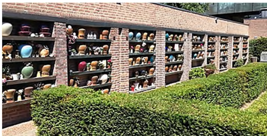
begraafplaats Zuylen Breda