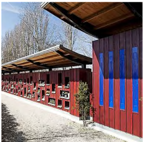
begraafplaats Rhijnhof Leiden