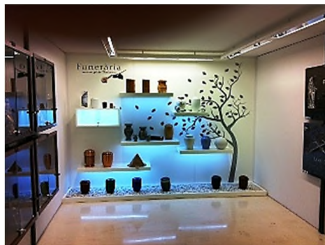
Gemeentelijk crematorium Terrassa - Barcelona