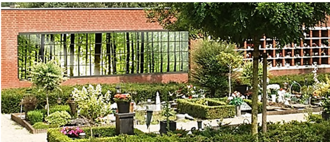
crematorium Rijtackers Eindhoven

Het verstrooien van as mag op open zee of op een daartoe bestemd strooiveld. De gemeente kan regels stellen aan het verstrooien van as op een bijzondere plek. Het is dus niet toegestaan om de as op een willekeurige plek te verstrooien.