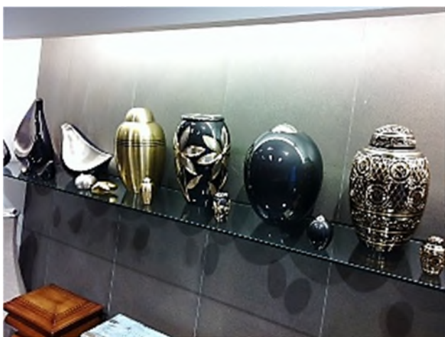
Tanatorio Grupo Irache-Pamplona

Het zou te kortzichtig zijn om te concluderen dat het aantal crematies toeneemt door de huidige economische crisis, de invloed daarvan is beperkt. Het totale aanbod van mogelijkheden is de laatste jaren aanzienlijk verruimd. Niet alleen de begraafplaatsen en funeraria, maar ook de grote inkoopgroepen geven ruim baan aan nieuwe ontwikkelingen in de uitvaartbranche. Daarom spreken we ook liever van een collectieve groei waaraan alle betrokkenen hun specifieke aandeel leveren. Door continue te innoveren en te stimuleren zal deze sector zich steeds verder ontwikkelen en aanpassen aan de tijdsgeest en maatschappelijke trends. Zo hebben wij geconstateerd dat de toepassing van heldere, moderne kleuren in alle producten zeer goed wordt ontvangen en zelfs een bijdrage levert aan een positieve wending daar waar het gaat om een delicaat onderwerp als de dood. De angst daarvoor neemt af dankzij al onze positieve energie in een markt die allang niet meer bruin, grijs of zwart is.