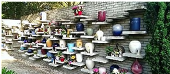
crematorium Capelle aan den IJssel