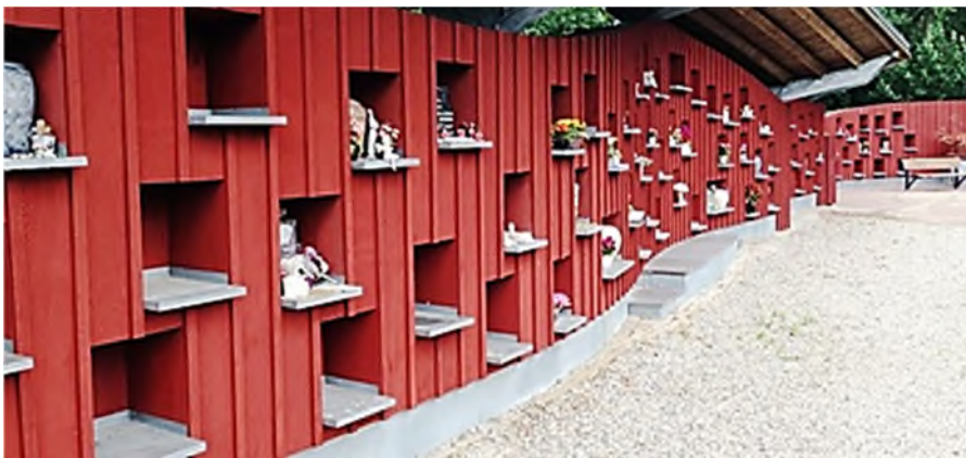
begraafplaats Rhijnhof Leiden

Ondanks de sociale verschillen en de verschillen in regelgeving in de landen van Europa, hebben zij gemeenschappelijk dat het percentage crematies de afgelopen jaren is toegenomen.