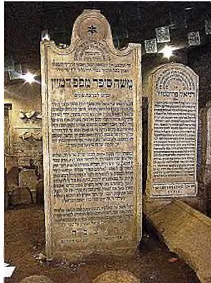
graf van Chatam Sofer