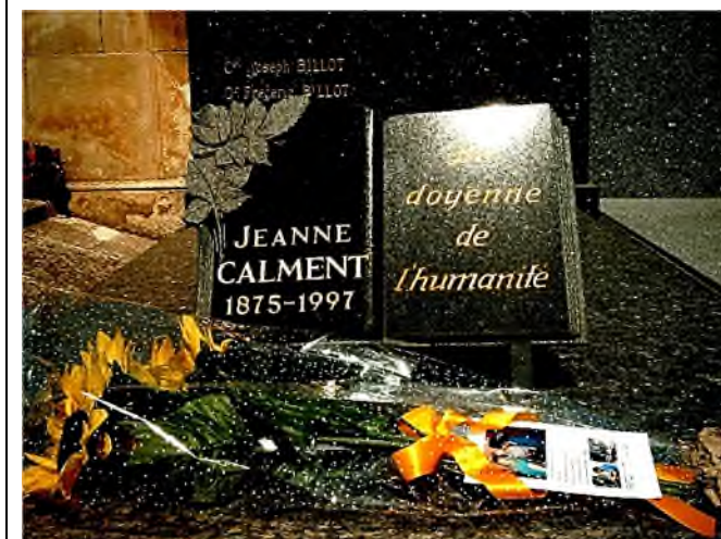
© 2007 tekst & foto's : Dr. Lucien De Cock.