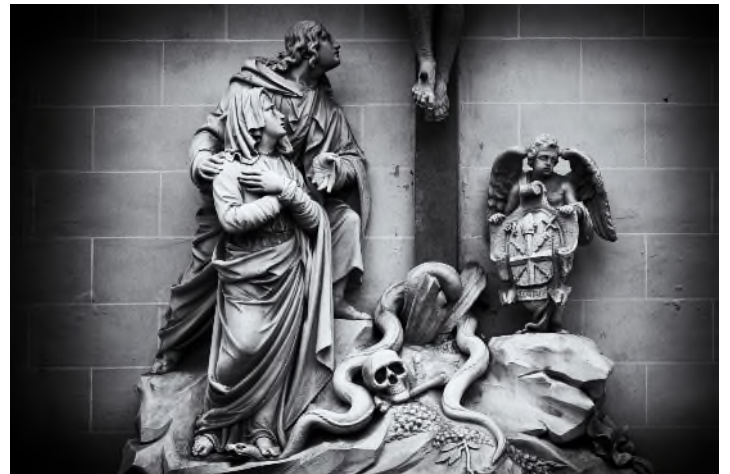
Begraafplaats St. Fredegandus - Deurne