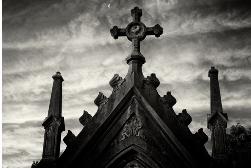
Begraafplaats Heidestraat - Kapellen