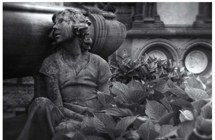
Begraafplaats St. Fredegandus - Deurne