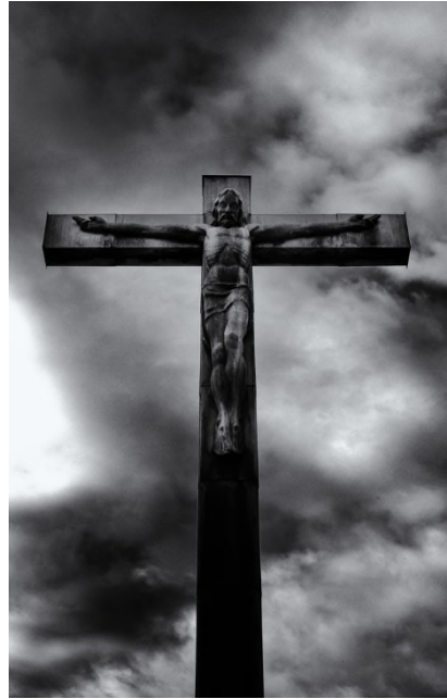
Begraafplaats Steytelinck - Wilrijk