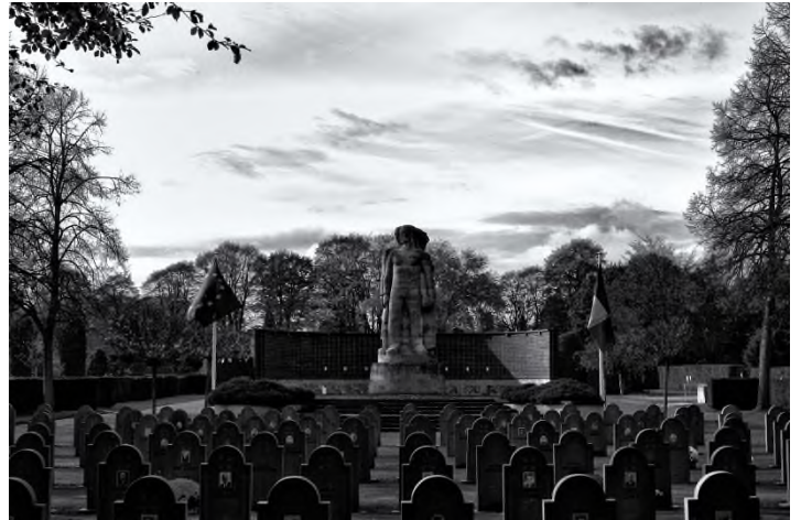
Begraafplaats Steytelinck - Wilrijk