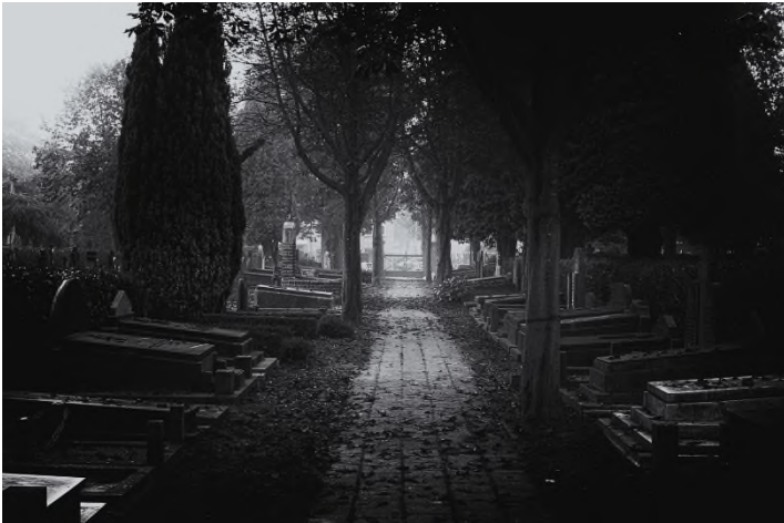
Begraafplaats Bredaseweg - Roosendaal