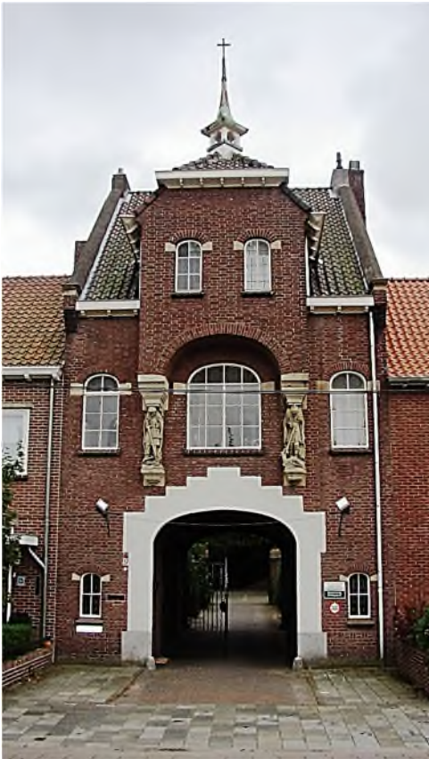
begraafplaats St. Joris