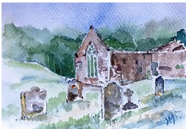
Portumna - Cistercian Abbey