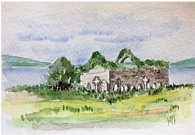
tussen Doolin en Ennistymon

Tijdens onze camperreis door Ierland in juni 2016 wordt het ons al snel duidelijk dat hier veel sporen van geschiedenis te vinden zijn getuige de ruïnes en veel begraafplaatsen die er vaak verwaarloosd bijliggen. Her en der in het landschap kom je opeens voor een ruïne te staan van een kerkje of een klooster, dat is ingenomen door de natuur met daaromheen de grafstenen schots en scheef. Dat kom je overigens vaker tegen op de Britse eilanden, waar Ierland ook onder valt. Begraafplaatsen en graven mogen daar wettelijk gezien niet geruimd worden en het aantal crematies neemt toe, waardoor kerkhoven en begraafplaatsen steeds minder vaak gebruikt worden en vervallen. Het levert wel mooie romantische plaatjes op, ideaal om er een aquarel van te maken zoals tussen Doolin en Ennistymon aan de westkust.