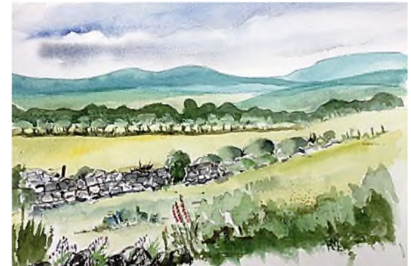
onderweg in Ierland