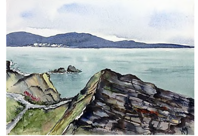
... naar Wicklow in het oosten

Eerst volgen we nog zoveel mogelijk de westkust zuidwaarts. We camperen bij 'spookslot' Carrigafoyle Castle, waar het 's nachts aardedonker is en waar kraaien en vleermuizen ons enige gezelschap zijn. Vanwege de slechte weg met kuilen en hobbels krijgen we autopech, maar een erg aardige Ierse familie onthaalt ons op koffie en cake, terwijl de heer des huizes onze camper repareert. Via Tralee bezoeken we het prachtige schiereiland Dingle. Daarna koersen we weer oostwaarts, via Killarney, waar we het Victoriaanse Muckrose House bezoeken met park en rotstuin. Dan is het niet meer a long way to Tipperary en ook niet naar Waterford, beroemd om zijn Crystal , en Rosslare, waarmee we weer aan de oostkust van Ierland zijn aangekomen. Vervolgens gaan we via Wicklow naar Greystones, waar we onze reis begonnen.