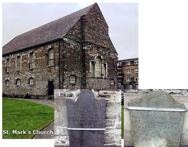
St. Mark's Church