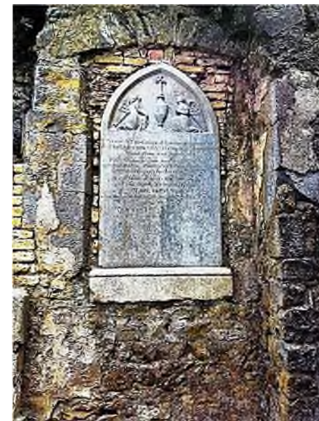
Portumna - ruïne van Cistercian Abbey met oude grafstenen

Onze reis gaat verder westwaarts tot we aan de andere kust van Ierland zijn aangekomen bij de Noordelijke Atlantische Oceaan. In de haven van Galway vinden we een camperplaats, waarna we de stad bezoeken, een bruisende stad met vriendelijke mensen. Overal wordt muziek gemaakt, in de pubs en ook