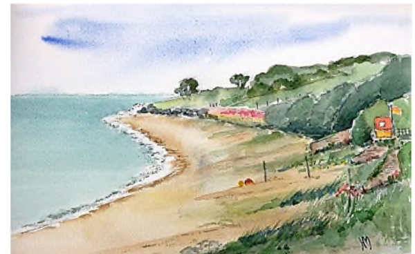
Ierse Zee bij Greystones