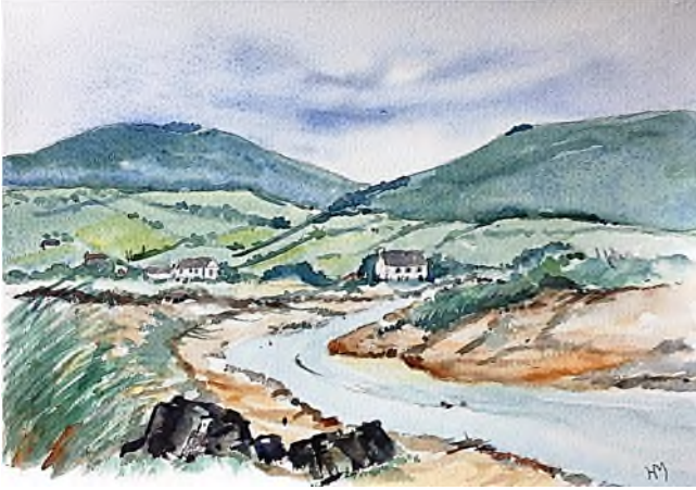
van Dingle in het westen...

Eerst volgen we nog zoveel mogelijk de westkust zuidwaarts. We camperen bij 'spookslot' Carrigafoyle Castle, waar het 's nachts aardedonker is en waar kraaien en vleermuizen ons enige gezelschap zijn. Vanwege de slechte weg met kuilen en hobbels krijgen we autopech, maar een erg aardige Ierse familie onthaalt ons op koffie en cake, terwijl de heer des huizes onze camper repareert. Via Tralee bezoeken we het prachtige schiereiland Dingle. Daarna koersen we weer oostwaarts, via Killarney, waar we het Victoriaanse Muckrose House bezoeken met park en rotstuin. Dan is het niet meer a long way to Tipperary en ook niet naar Waterford, beroemd om zijn Crystal , en Rosslare, waarmee we weer aan de oostkust van Ierland zijn aangekomen. Vervolgens gaan we via Wicklow naar Greystones, waar we onze reis begonnen.