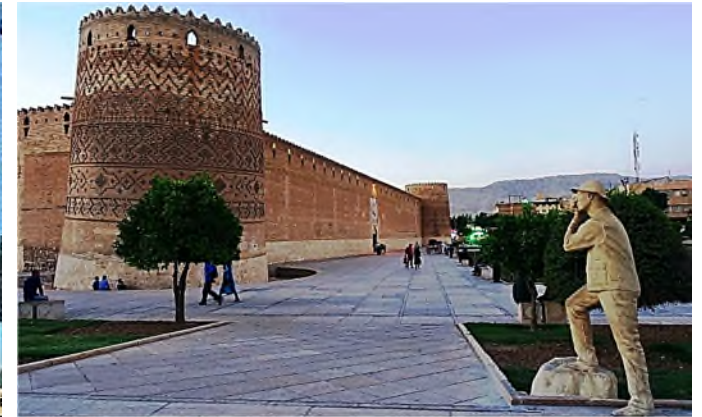
Shiraz - Karim Khan Citadel en standbeeld fotograaf