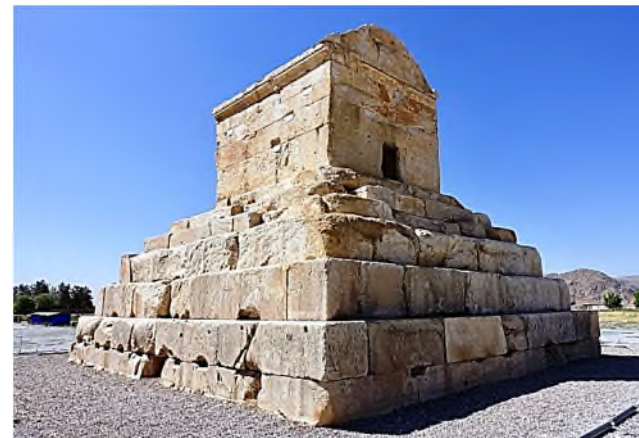
Pasargadae - tombe Cyrus II de Grote