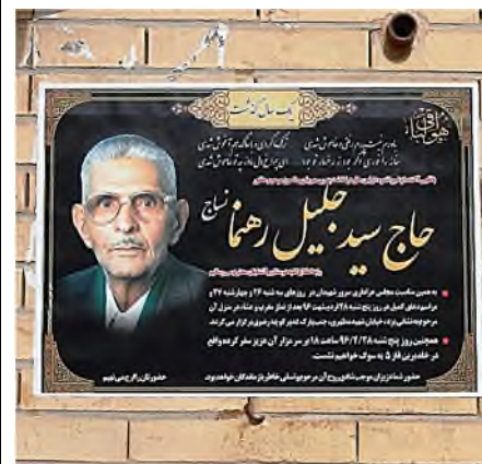
overlijdensbericht aan de muur

De woestijnwind had vrij spel op de begraafplaats. Helaas kon de korankast wel een opruimende hand gebruiken en de muur erachter een opknopbeurt.