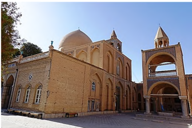
Armeense kathedraal - exterieur