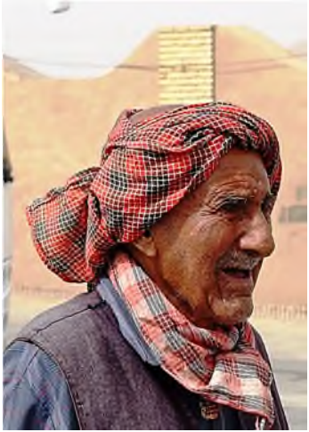
92-jarige oude lijkendrager, nu lijkenwasser