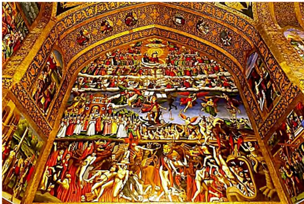
Het Laatste Oordeel: Hemel - Aarde - Hel

Tevergeefs hebben wij in Isfahan nog naar een tuinman gezocht!