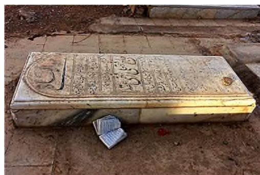
vrij spel voor de woestijnwind