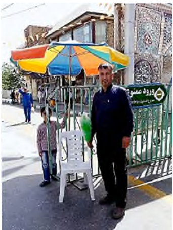
Qom - bewaker met plumeau