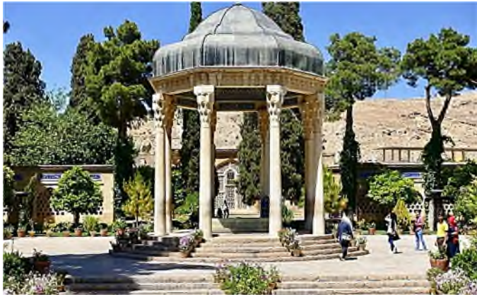
Shiraz - Mausoleum van Hafez