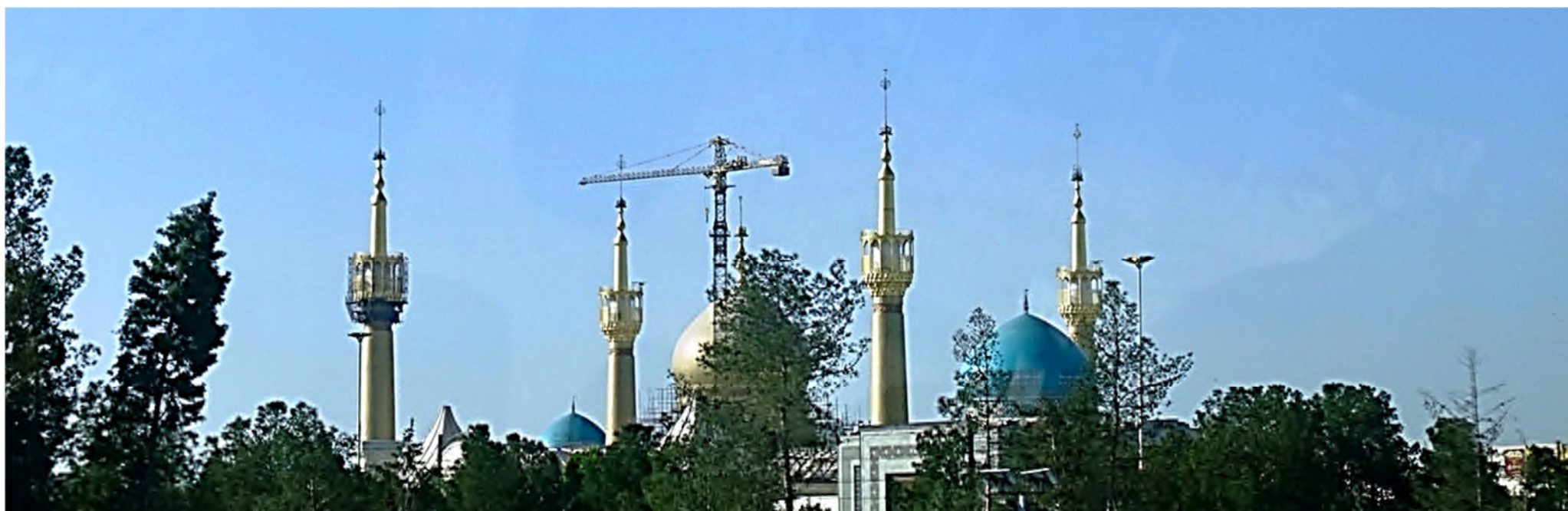
Mausoleum Ayatollah Khomeini