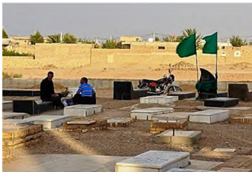
rouwende man bij het graf van zijn pas overleden moeder