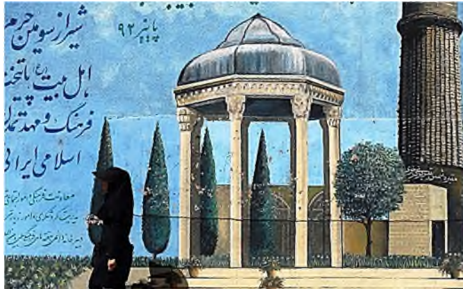
Shiraz - muurschildering van het mausoleum