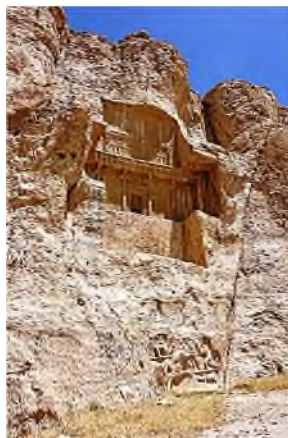
Persepolis - Naqsh-e Rostam - graf Darius I (rechts) & Artaxerxes I