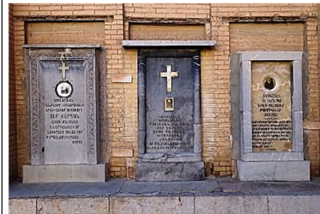
graven bij de Armeense kathedraal

De Armeense kerk vraagt met behulp van een museum en monumenten aandacht voor de Armeense genocide. Buiten de kerk, maar wel binnen een ommuring zijn er graven.