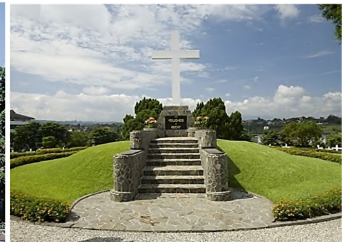
monument voor Veiligheid en Recht