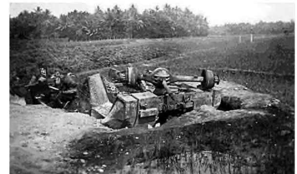
het pantservoertuig na de explosie