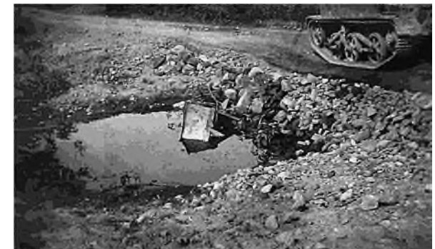
de krater na de explosie van de trekbom