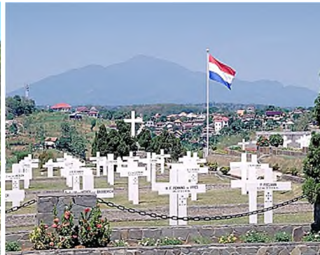
Ereveld Candi te Semarang op Java