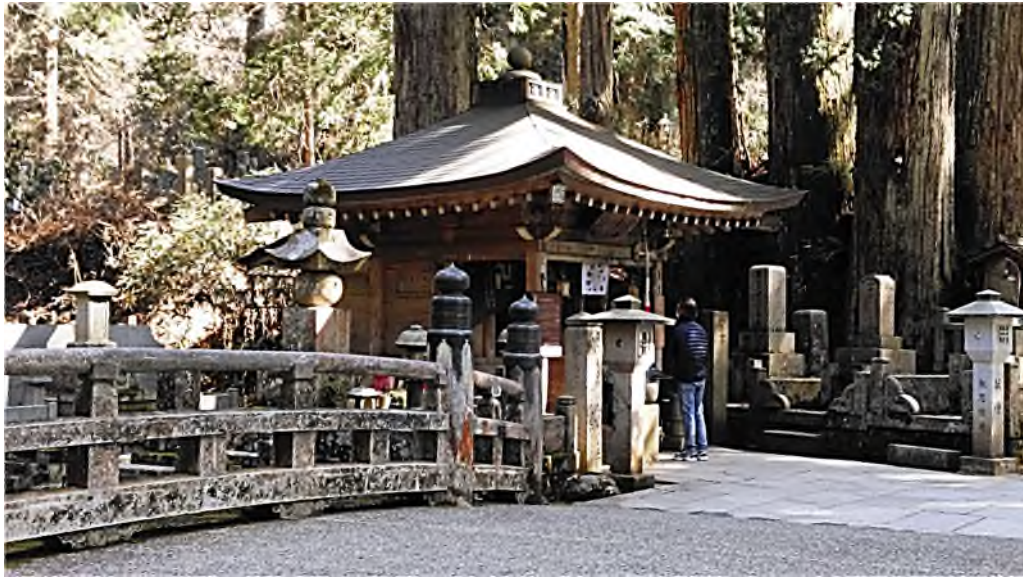
middelste brug van het pelgrimspad