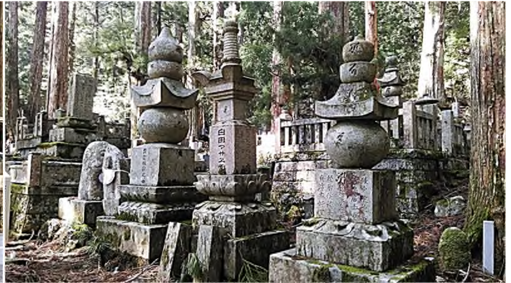
enkele van de ruim 200.000 grafstenen