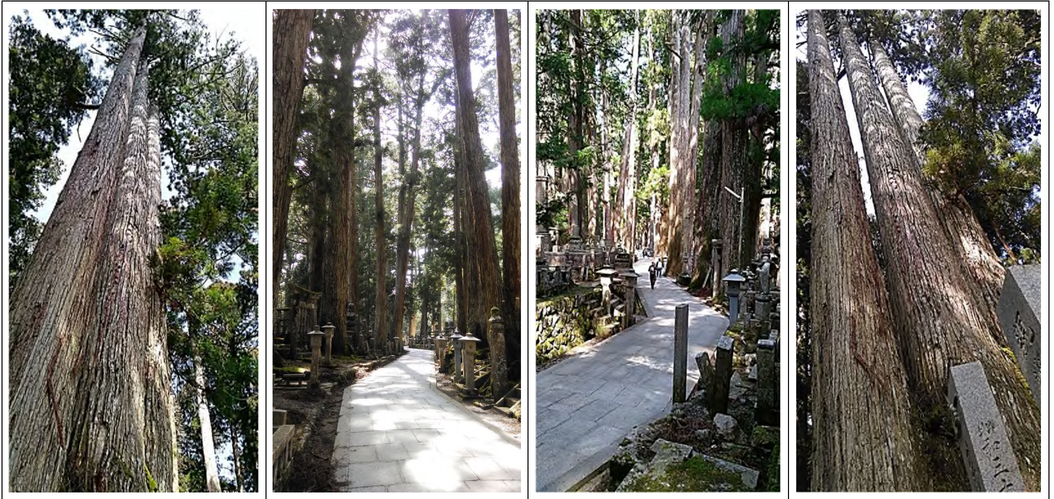
pelgrimspad over de Okunoin begraafplaats

Aan weerszijden van het pad staan stenen lantaarns en daarachter de meer dan 200.000 grafstenen, waarvan de oudste stamt uit 997. Gedurende eeuwen hebben velen in het verlangen dicht bij Kūkai te liggen om verlossing te ontvangen hier hun grafteken opgericht, waaronder prominente monniken, samoeraikrijgers en hoge aristocraten.