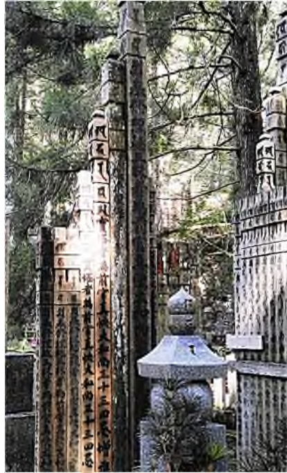
houten planken met teksten van gedichten

Voordat de bezoeker de derde en laatste brug, de Gobyonohashi-brug, overgaat om het heilige grondgebied van de Torodo-lantaarntempel en het mausoleum te betreden dient opnieuw purificatie plaats te vinden.