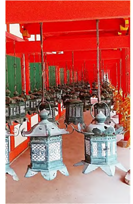
Torodo - lantaarntempel

Van twee lantaarns wordt gezegd dat ze hier al vanaf het begin hangen en onafgebroken gebrand hebben.