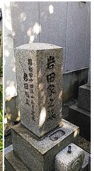
Kyoto: wijkbegraving met oude en nieuwe grafstenen