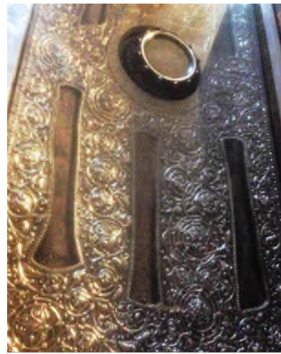
Larnaca: St. Lazarus - relieken (detail)