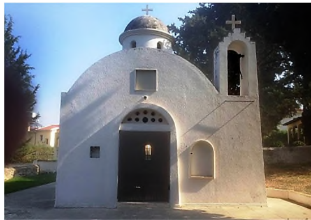
Alsancak bij Kyrenia: orthodoxe begraafplaats