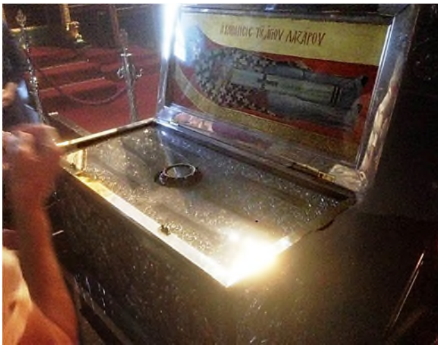
Larnaca: St. Lazarus - relieken