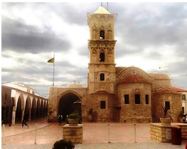
Larnaca: St. Lazaruskerk

In 1925 werd het eiland een kroonkolonie. De Tweede Wereldoorlog ging aan Cyprus niet voorbij en vanzelfsprekend zijn ook hier oorlogsbegraafplaatsen, maar die zijn niet anders dan elders.