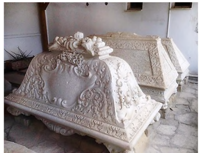
Larnaca: Engelse begraafplaats