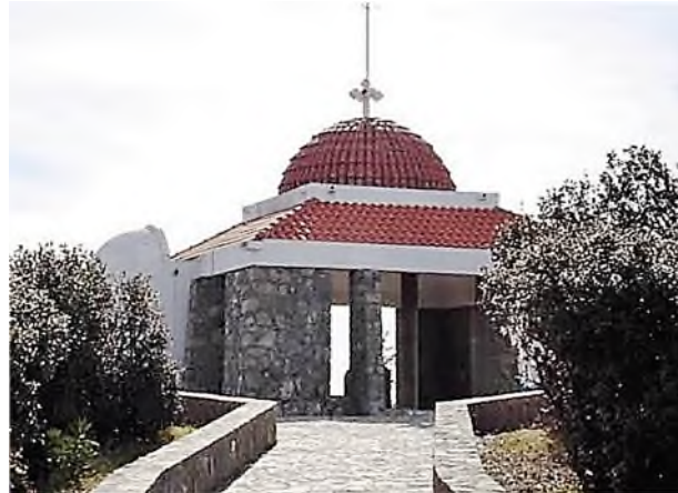
grafkapel van Makarios III