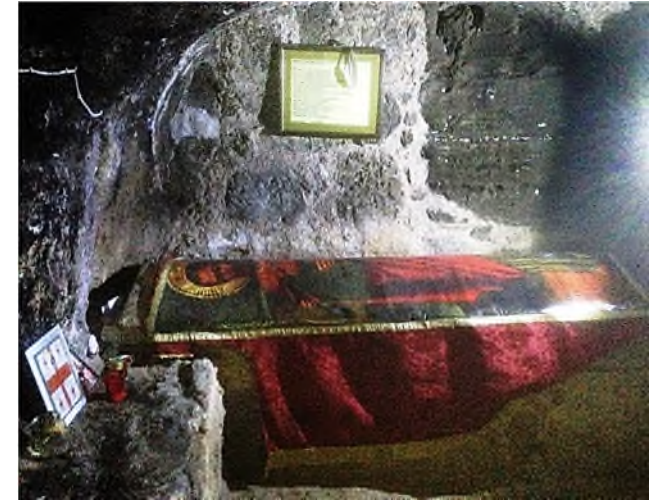
Famagusta: graf St. Barnabas