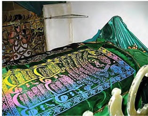
graf van Umm Haram