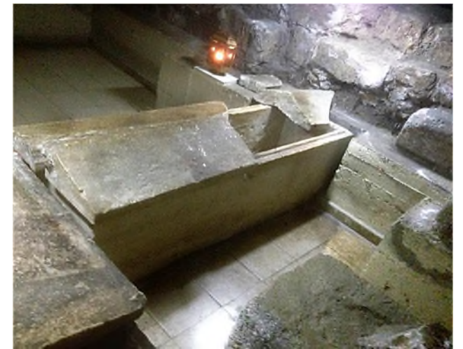
Larnaca: St. Lazarus - (lege) graftombe