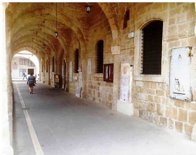
zerken tegen de St. Lazaruskerkmuur