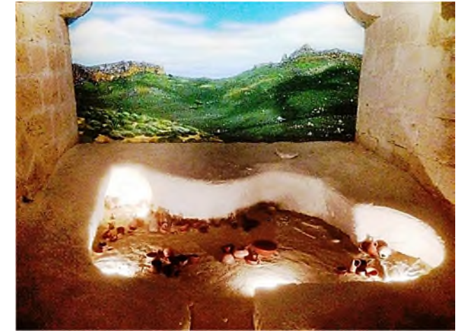
Kyrenia Castle: graven uit de Bronstijd

Kyrenia: In Kyrenia parkeerde de bus op een grote parkeerplaats. Vlak ernaast keken we naar de overblijfselen van de ooit uitgestrekte Ottomaanse begraafplaats 'Baldoken', waar zich onder andere het graf van een Pasha bevindt.