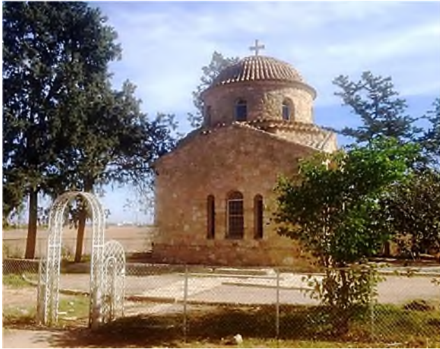
Famagusta: St. Barnabasklooster