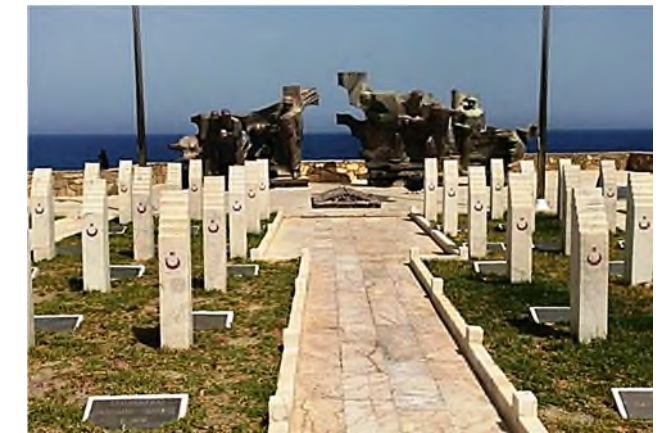
islamitische oorlogsbegraafplaats (Kyrenia)