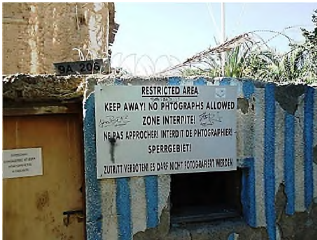
Nicosia: verdeelde stad

maar de schitterende badplaats Varosha, een wijk van Famagusta in het buffer-gebied is een complete spookstad geworden, zelfs met verroeste auto's in de straten. Met de bus reden we langs leegstaande, vervallen huizen achter prikkeldraad.