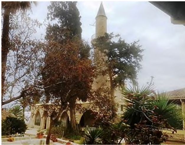
Larnaca Zoutmeer: moskee Hala Sultan Tekke