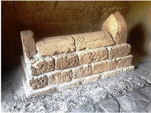
Kyrenia Castle: tombe admiraal Sadik Pasha