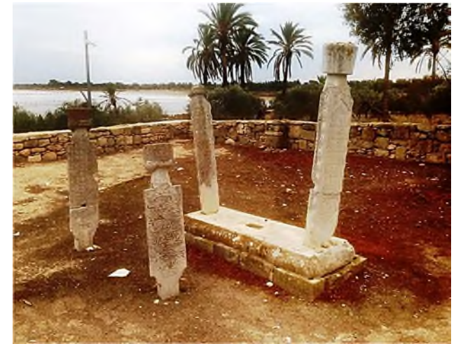
islamitische begraafplaats rond de moskee