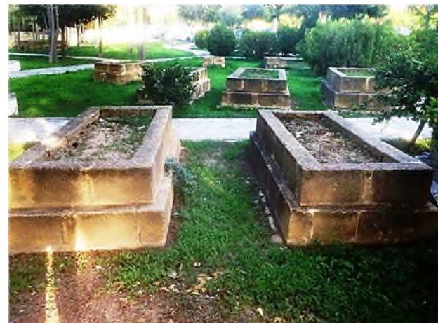
Kyrenia: Ottomaanse begraafplaats Baldoken