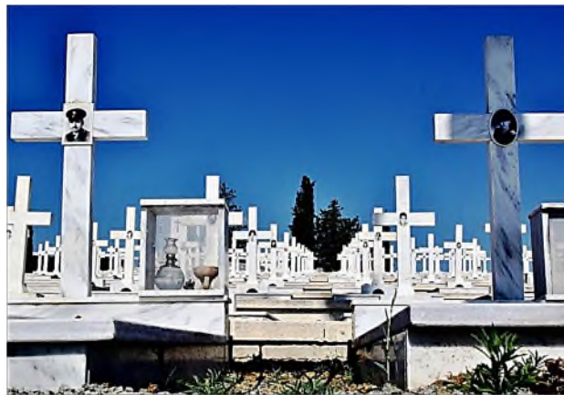
orthodoxe oorlogsbegraafplaats (Zuid-Nicosia)