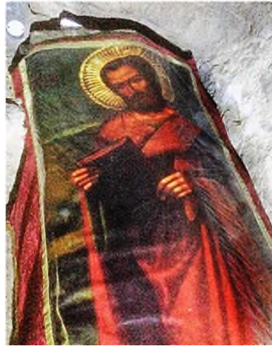
Famagusta: St. Barnabas