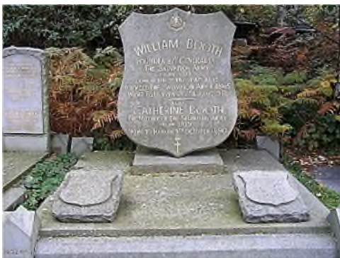
William & Catharina Booth

In Groot-Brittannië was Bunhill Fields de campo santo van non-conformisten van eind 17 e en de hele 18 e eeuw, terwijl Abney Park dat was tijdens de Victoriaanse periode en dan vooral van predikanten en opvoedkundigen uit de kringen van Congregationalisten, Baptisten, Methodisten en Leger des Heils. De meest bekende personen, die er begraven liggen, zijn William en Catherine Booth, de stichters van het Leger des Heils. Zij zijn samen met hun oudste zoon en opvolger en met een aantal heilssoldaten begraven op het zuidelijke deel van Abney Park Cemetery.