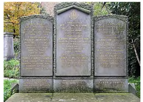
Commissioners vh Leger des Heils