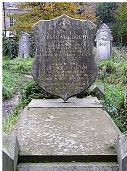
Bramwell & Florence Booth