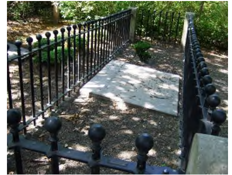
Haarlem - Vereenigde Doopsgezinde Gemeente

Op begraafplaats Kleverlaan in Haarlem is een apart grafvak, omgeven door een stevig hek, van de Vereenigde Doopsgezinde Gemeente. Volgens de aanduiding op de grafsteen is het een familiegraf van acht predikantenfamilies van de V.D.G.