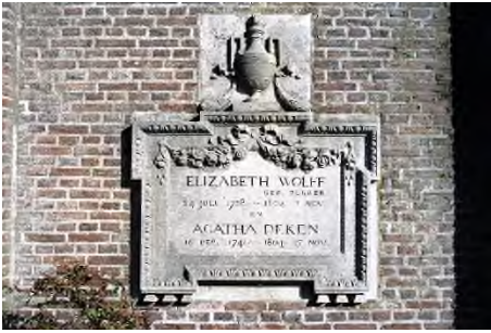
Betje Wolff & Aagje Deken

In Nederland werden de Mennonieten aanvankelijk vervolgd of ge-doogd. Vanaf de 18de eeuw schoven velen van hen op naar de vrijzinnige hoek en noemden zich Doopsgezinden. In 1811 sloten verschillende richtingen zich aaneen tot de Algemene Doopsgezinde Sociëteit.