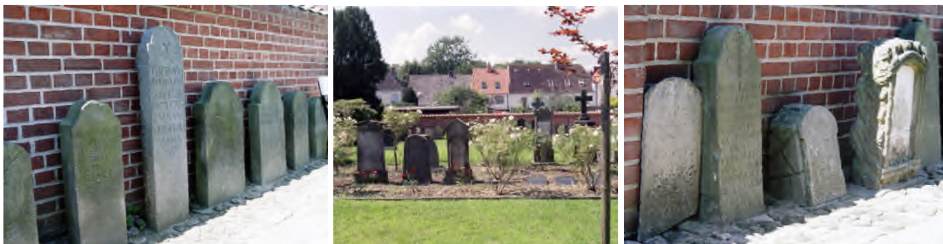
Friedrichstadt - Mennonitenfriedhof

Omdat de Mennonieten goede kooplui waren, schonk hertog Friedrich hen in 1623 het privilege zich in Friedrichstadt te vestigen.