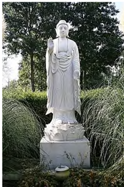
Amsterdam - Zorgvlied