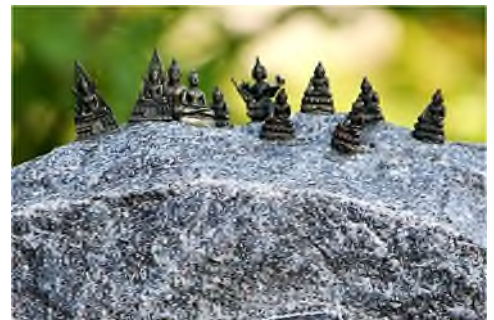
Eindhoven - De Roosten