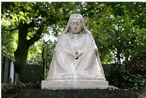
Den Haag - Nieuw Eykenduynen

Op begraafplaatsen kom je geregeld Boeddhistische invloeden tegen. In Duitsland en Oostenrijk bestaat de Friedhofszwang , de wettelijke verplichting binnen de grenzen van een begraafplaats te begraven en na crematie bij te zetten. Daardoor ontstond de wens van Boeddhistische groeperingen naar eigen grafvelden op begraafplaatsen, een wens die in een aantal steden werkelijkheid is geworden.