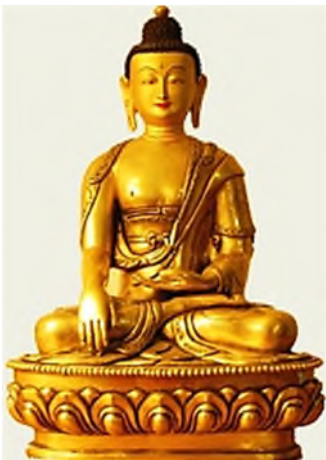
Boeddha - Nepal

Het Boeddhisme is een levensbeschouwelijke stroming, die ontstaan is in de vijfde eeuw voor Christus en die, hoewel het geen god kent, tot de grote wereldgodsdiensten wordt gerekend. Het heeft zijn naam ontleend aan Boeddha, de bijnaam van prins Siddharta Gautama.