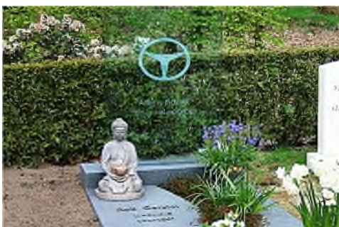
Blaricum - Algemene Begraafplaats