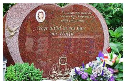
Amsterdam - De Nieuwe Ooster