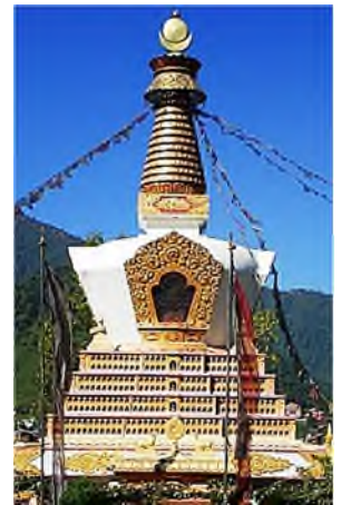
Stupa - Nepal

Volgens de mythische overlevering leefde Siddharta Gautama in het grensgebied van Nepal en India, waar hij binnen de muren van het paleis beschermd opgroeide, er trouwde en een zoon kreeg, maar niet gelukkig was. Op een rijtoer buiten het paleis ontmoette hij achtereenvolgens een bejaarde, een zieke en een dode, symbolen van 'het lijden', en een ascet, een mogelijke oplossing uit 'het lijden'. Hij vertrok uit het paleis om de verlossing uit het lijden en de kringloop van het bestaan te vinden. De poging dat via ascetisme