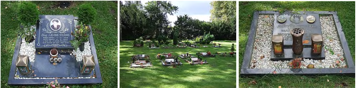
Hannover - Friedhof Seelhorst: Boeddhistisch urnenveld

Ook elders in Duitsland zijn er Boeddhistische grafvelden op een paar stedelijke begraafplaatsen. In 2003 werd op Friedhof Ruhleben in Berlijn een Boeddhistisch grafveld in gebruik genomen voor de Vietnamees-Boeddhistische gemeente. Op het veld, dat achteraan op de begraafplaats ligt is plaats voor 100 zandgraven en 600 urnengraven; in het midden staat een 4,30 m hoog beeld van bodhisatva Ksitigarbha (Vietnamees: Tian Tan). Ook in Hamburg en Mönchengladbach zijn Boeddhistische grafvelden.