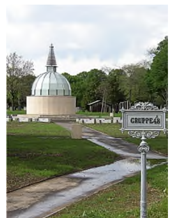
Wenen - Zentralfriedhof: Boeddhistische begraafplaats