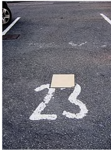
parkeerplaats graf John Knox