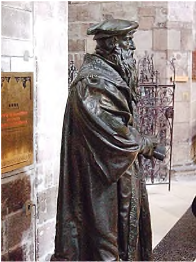
St. Giles' Cathedral beeld John Knox

Op de parkeerplaats in vak no. 23 bevond zich eens het graf van John Knox die hier enkele jaren na de officiële sluiting van het kerkhof werd begraven. Een gele tegel in het asfalt geeft de plek aan. Meestal is het niet te zien, omdat er een auto bovenop staat. In 2013 kwam er een plaquette bij met verklaring.