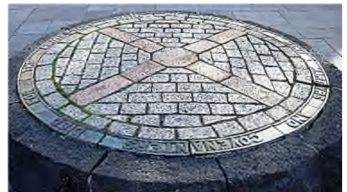
Grassmarket - Covenanter's Memorial

In 1690 werd door Willem III van Oranje in de Revolution Settlement de Church of Scotland in zijn presbyteriaanse vorm erkend als de kerk van Schotland. Op de Grassmarket bevindt zich op de plaats waar vroeger de galg stond een verhoogde cirkel met een Andreaskruis. Het is de Covenanter's Memorial ; het randschrift luidt: For the Protestant faith, on this spot many martyrs and covenanters died.