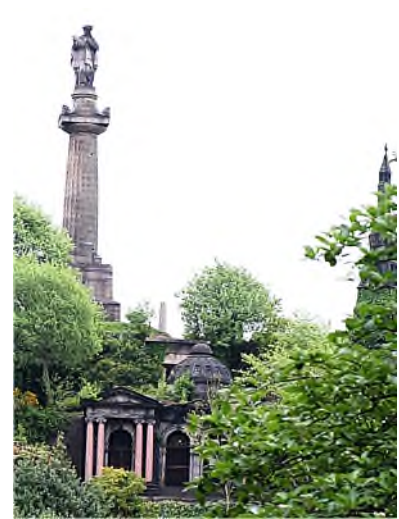
Glasgow Necropolis John Knox Monument