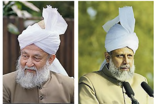
Mirza Tahir Ahmad Mirza Masroor Ahmad

Na de dood van Ahmad in 1908 werd de geestelijke leiding van zijn volgelingen overgenomen door een gekozen opvolger of kalief. Tot nu toe zijn dat er vijf geweest, allemaal afstammelingen in rechte lijn van de stichter. Na de verkiezing in 1914 van de tweede kalief, de 25-jarige zoon van Mirza Ghulam Ahmad, splitste de beweging zich in twee groepen: de Ahmadiyya Moslim Gemeenschap en de Lahore Ahmadiyya Beweging. De laatste groep, die minder aanhangers heeft, zien in Mirza Ghulam geen profeet, dat is Mohammed, maar zien hem als een hervormer. Ze staan dicht bij de 'gewone' islam. Als gevolg van de vervolgingen van ahmadimoslims moest de vierde kalief Mirza Tahir Ahmad (1928-2003) in 1984 uit Pakistan vluchten, waarna hij het hoofdkwartier van de Ahmadiyya Moslim Gemeenschap vestigde in Londen. Na zijn dood werd Mirza Masroor Ahmad (1950) de vijfde Khalifatul Masih (kalief).