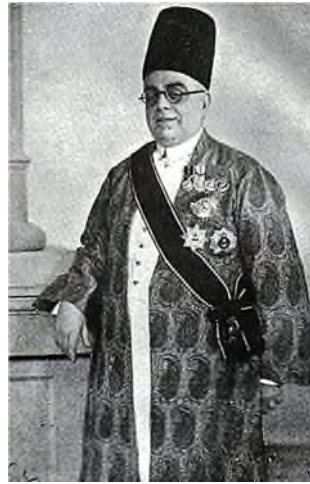
Aga Khan III (1877-1957)