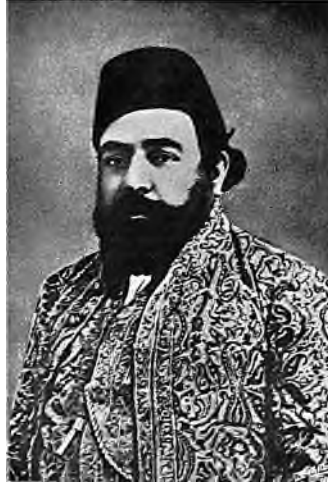
Aga Khan II (1830-1885)