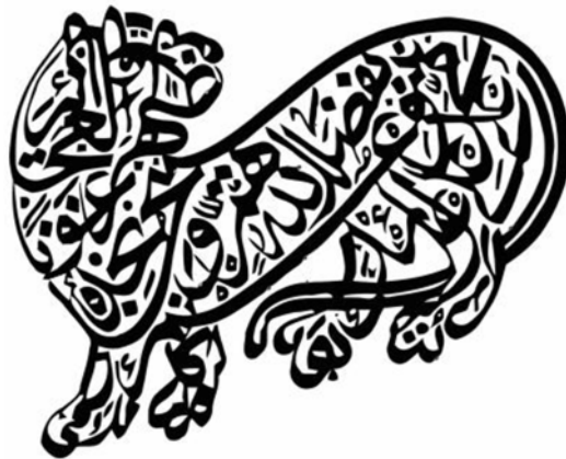
Isma'ilitisch kalligram: Ali als tijger van Allah