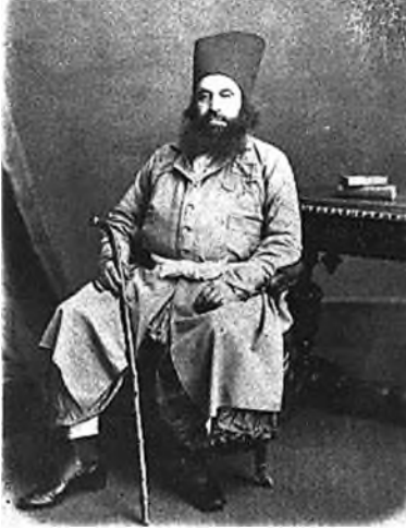
Aga Khan I (1804-1881)

Aga Khan IV was de oudste zoon van paardenkenner en playboy Prins Aly Khan (1911-1960) en zijn eerste vrouw Princess Tajuddawlah Aly Khan, voorheen Joan Barbara Yarde-Buller (1908-1997), van wie hij in 1949 scheidde; zijn tweede vrouw was filmster Rita Hayworth. Prins Aly Khan werd tot verbazing bij de dood van zijn vader Sir Sultan Muhammed Shah, Aga Khan III (1877-1957) in 1957 in diens testament overgeslagen toen de titel Aga Khan rechtstreeks naar zijn oudste zoon ging.