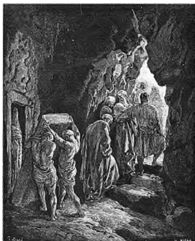
Gustave Doré - Genesis 23

Van oorsprong waren er bij de Joden geen vaste regels voor graf, begraafplaats en grafteken. In de tijd van de aartsvaders werden de doden bijgezet in natuurlijke grotten, later in kunstmatig aangelegde grafkamers en catacomben. In Genesis 23 wordt verteld over Sara's dood en begrafenis: Daarop begroef Abraham zijn vrouw Sara in de grot op de akker van Makpela, ten oosten van Mamre of Hebron, in Kanaän. Zo werd het stuk grond met de grot door de Hethieten aan Abraham overgedaan en kreeg hij een eigen begraafplaats (Gen. 23,19-20). In Gen. 25,9 wordt hij in dezelfde grot begraven. Volgens de joodse traditie werden in die grot de Bijbelse paren Adam en Eva, Abraham en Sara, Izaäk en Rebecca en Jacob en Lea bijgezet. De Grot van de Patriarchen in Hebron is nog steeds een pelgrimsoord voor Joden en moslims.