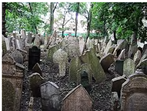
Praag - oude joodse begraafplaats

Op veel joodse begraafplaatsen is er een gebouwtje voor de reiniging van de overledene en een fonteintje om de handen te wassen bij het verlaten van de begraafplaats, omdat doden onrein zijn.