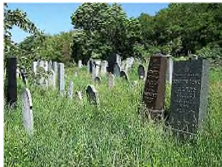
Bratislava - Židovský Cintorín