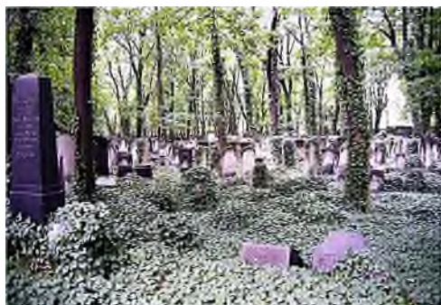
Berlijn - Schönhauser Allee

In tegenstelling tot de vele regels rond de lijkbezorging hebben Joden nauwelijks voorschriften over het inrichten en onderhoud van begraafplaatsen. De voornaamste voorschriften zijn: geen beplanting aanbrengen, alleen het hoogst noodzakelijk onderhoud plegen en het plaatsen van een grafsteen. Omdat de rust van de dode op geen enkele wijze verstoord mag worden zijn beplantingen, die sappen aan de grond onttrekken, volgens de joodse wet niet toegestaan. Vaak is er op de begraafplaats wel sprake van spontaan opgekomen gras en bomen. Mochten dat vruchtbomen zijn, dan mag men geen profijt hebben van wat er op de begraafplaats groeit. Men onderhoudt er alleen het noodzakelijke.