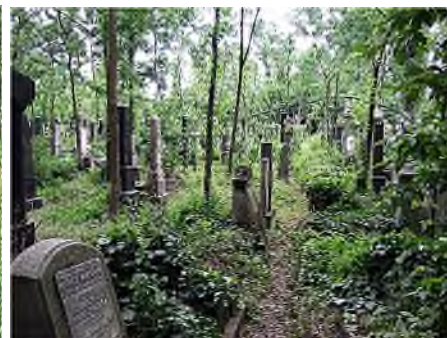
Boedapest - Temető israelska

Wanneer een begraafplaats 'vol' is, is het Joden toegestaan boven de bestaande graven een nieuwe laag aarde aan te brengen, waarbij de afscheiding tussen beide lagen '6 handbreedtes' (= ca. 60 cm) bedraagt. Vaak werden de grafstenen op de graven van de onderste laag gelegd en werd vervolgens de zaak opgehoogd. Soms ook werden de grafstenen mee omhooggetrokken, waardoor er een woud van graftekens ontstond, zoals op de oude joodse begraafplaats in Praag.