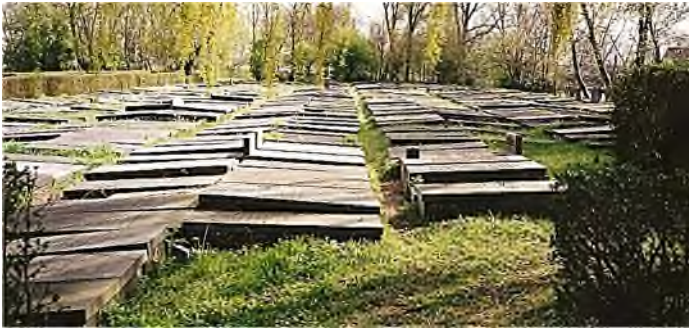
Ouderkerk a/d Amstel: Sefardisch

Er is een opmerkelijk verschil bij de inrichting van de begraafplaats tussen twee groepen Joden in Europa: de Sefardim , vaak Portugese Israëlieten genoemd, die te herkennen zijn aan een liggende zerk als grafteken en de Azkenazim , vaak aangeduid als Hoogduitse Joden, die een staande stèle plaatsen.