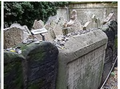
Worms - Bratislava - Praag: 'je steentje bijdragen'