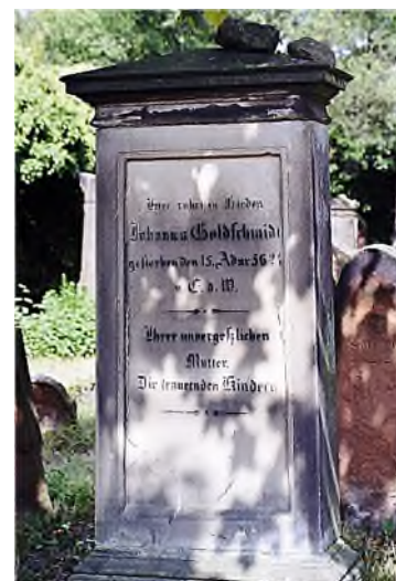
Worms: vanaf 18 e eeuw

De begraafplaats bestaat uit twee delen. Op het oudste stuk werd vanaf de 11 e eeuw, op het nieuwste vanaf de 18 e eeuw begraven. De vorm van de grafsteen op het oude deel bestaat uit een ruw zandsteenblok, waar op de voorkant Hebreeuwse letters zijn ingekrast. Op het nieuwe deel is een grote variatie aan grafmonumenten met Hebreeuws/Duitse of alleen Duitse tekst.