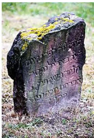
Worms: vanaf 11 e eeuw

Hoe meer Joden geaccepteerd werden, hoe meer Joden zich assimileerden. Een mooi voorbeeld daarvan is de oudst bewaard gebleven joodse begraafplaats van Europa, 'Der Heilige Sand' in Worms .