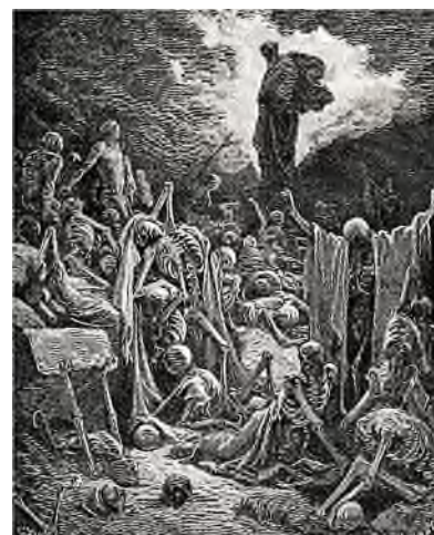
Gustave Doré - Ezechiël 37

De ziel van de mens komt van boven, het lichaam van de aarde. Bij de dood keert de ziel terug naar zijn bron (God) en het lichaam wordt aan de aarde teruggegeven. In Deut. 21,23 staat Maar gij zult hem dezelfde dag nog begraven , waaruit de Talmoed concludeert dat het lichaam in zijn geheel moet worden begraven en niet mag worden gecremeerd. Het lichaam mag ook niet worden verminkt door bijvoorbeeld obductie. Daarbij komt het geloof in de wederopstanding, waarbij vaak het visioen van de profeet Ezechiël wordt aangehaald over 'het dal der dode beenderen' (Ezechiël 37,1-14). Dit zegt Jahwe de Heer: Ik ga uw graven openen; Ik wek u in groten getale daaruit op en voer u terug naar Israëls grond (Ez. 37,12). Dit heeft geleid tot de plicht van de eeuwige grafkrust. Graven mogen niet geruimd en slechts in hoogst uitzonderlijke gevallen verplaatst worden.