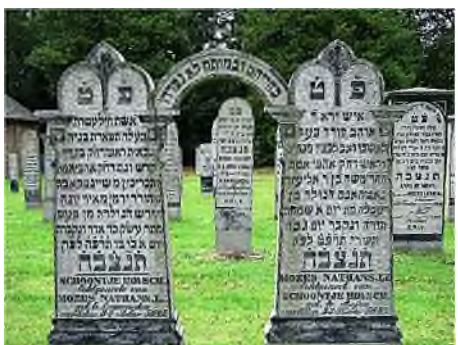
Drente - Assen