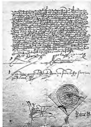
Edicto de Granada

Voor de Sefardim , de joden in Spanje, was 1492 een dramatisch jaar. Columbus ontdekte Amerika, de laatste Moor werd uit Spanje verdreven, maar ook de joden moesten Spanje verlaten. Dat gebeurde in het verdrijvingsedict of Edicto de Granada dat door het katholieke koningspaar Ferdinand II van Aragón en Isabella van Castilië op 31 maart 1492 in Granada werd uitgevaardigd en op grond waarvan de Spaanse joden gedwongen werden Spanje te verlaten of christen te worden. In eerste instantie vonden velen hun toevlucht in Portugal, maar