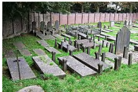
Zuid-Holland - Den Haag