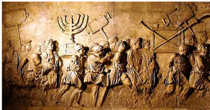
detail op triomfboog van Titus: de tempelschatten worden naar Rome vervoerd

De verovering en verwoesting van Jeruzalem in 70 n.Chr. door de Romeinse veldheer en latere keizer Titus wordt gezien als het begin van de diaspora, de verdrijving van de joden uit hun land en de verstrooiing van hen over de hele wereld. Anderen laten de diaspora al beginnen bij de Assyrische (733 v.Chr.) en/of Babylonische (586 v.Chr.) ballingschap. Feit is dat er in 70 n.Chr. al meer joden in joodse gemeenschappen buiten Palestina woonden dan in Palestina zelf, de toenmalige naam voor Israël. Aan het einde van de tweede eeuw waren de joden wijdverspreid, maar overal vormden ze minderheden en overal werden ze beschouwd als vreemdelingen. In de gebieden die veroverd waren door de islam, werden ze door de moslims geaccepteerd, omdat ze net als de christenen behoorden tot de 'volken van het Boek'. Vooral in (islamitisch) Spanje kon de joodse cultuur tot bloei komen en veel joden bezetten hier belangrijke posities. In christelijk Europa was de situatie minder rooskleurig, zo niet vaak rampzalig. De joden werden aangemerkt als de