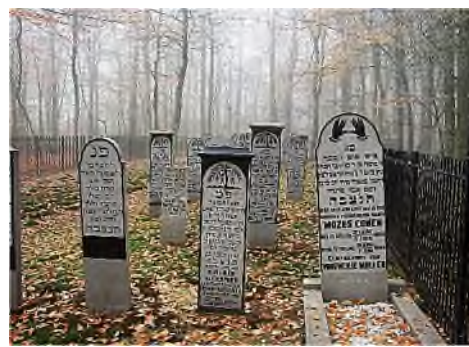
Groningen - Ter Apel