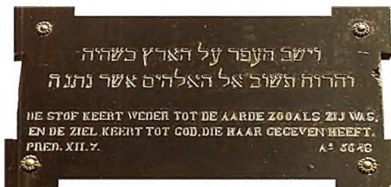
Arnhem - Joodse Begraafplaats Moscowa