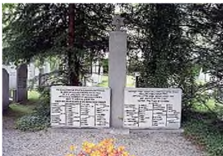
Zeeland - Middelburg