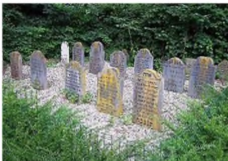
Noord-Brabant - Cuijk