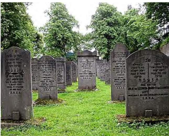
Eindhoven - Azjkenazisch