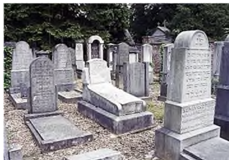
Limburg - Maastricht