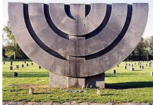
Terezin - menora op joodse begraafplaats