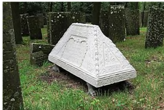
Muiderberg: Sefardische Ohel (tentgraf)