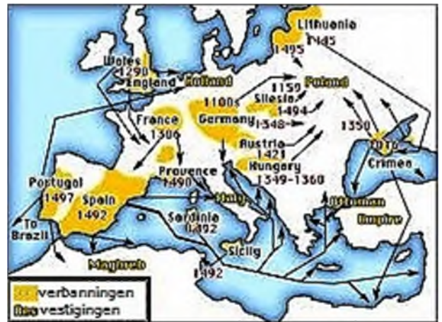
jodenvervolgingen in de middeleeuwen

Joden die uit het islamitische rijk, o.a. Spanje, Portugal en Noord-Afrika kwamen, worden Sefardim genoemd.