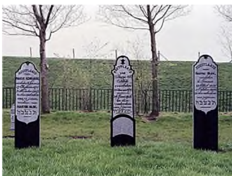
Friesland - Tacozijl (Lemmer)