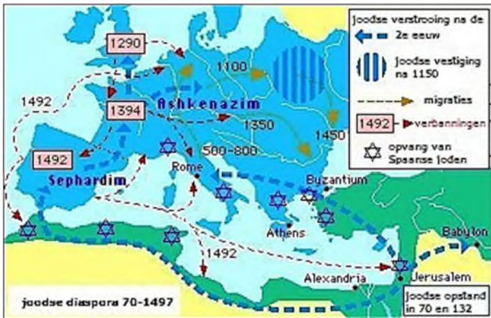
joodse diaspora 70 n.Chr. - 1497

Er zijn twee stromingen te onderkennen, de Azjkenazim en de Sefardim.