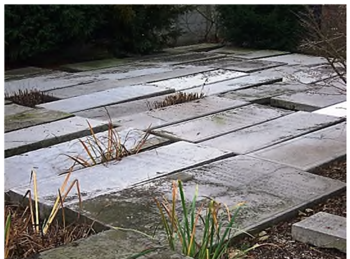
Middelburg - Sefardisch