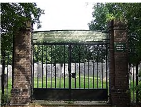
Overijssel - IJsselmuiden