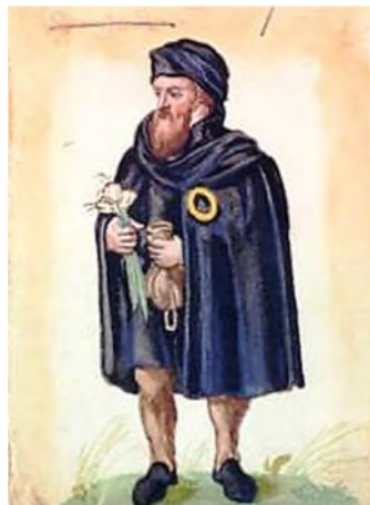
Azjkenazische jood 16 e eeuw

Vanwege vervolgingen in de 16 e en 17 e eeuw trokken de Azjkenazim weer westwaarts. Vooral na de Dertigjarige Oorlog (1618-1648) in