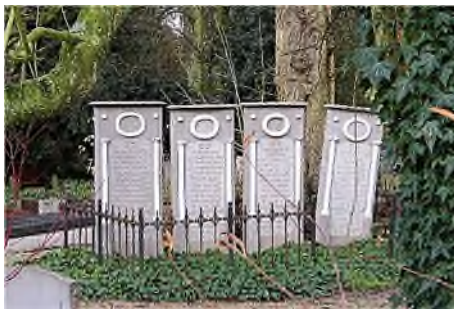
Utrecht - Kovelswade (Hamburger)