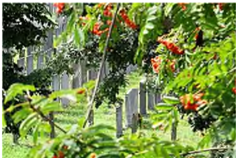
Noord-Holland - Muiderberg