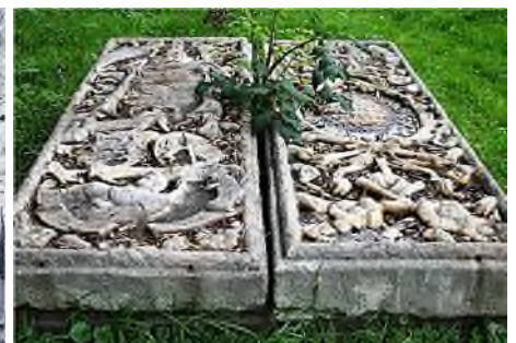
Ouderkerk aan de Amstel - Beth Haim