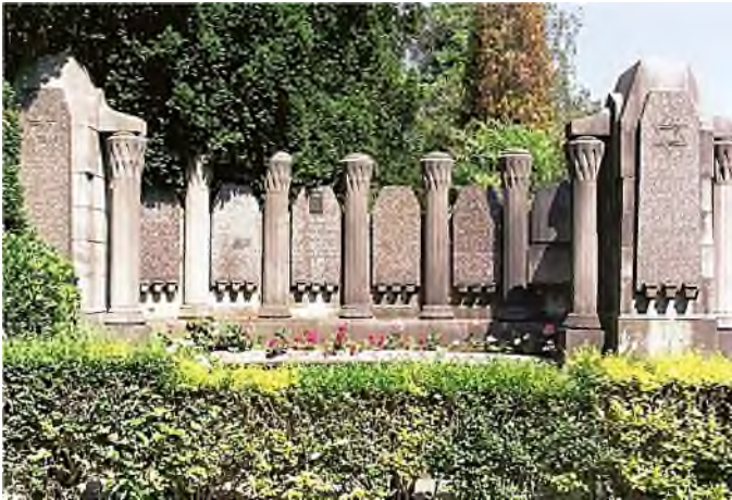
Dieweg - Ukkel: Familie Philippon

grafurst een must is, laten liberale joden zich wel in België begraven. Wat vaak wordt aangeduid met joodse begraafplaats in België blijkt een aparte perceel te zijn op een gemeentelijke begraafplaats, zoals bijvoorbeeld op de begraafplaatsen Dieweg in Ukkel bij Brussel, Schoonselhof bij Antwerpen, Etterbeek in Wezembeek-Oppeem, Oostende en Arlon.