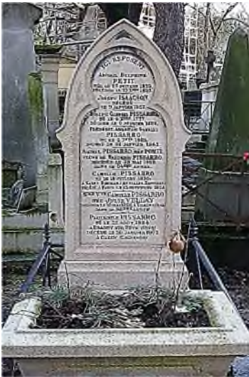
PL div.7 - Pissarro