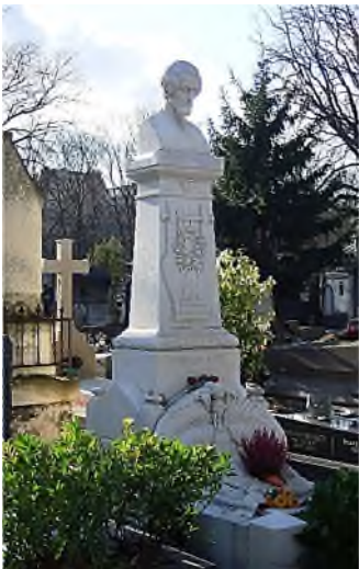
MM div. 27 - Heine