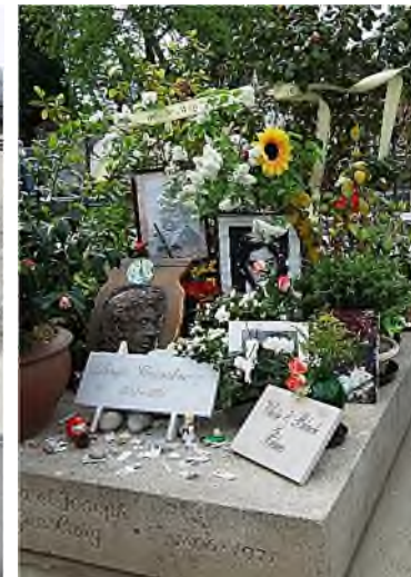
MP div. 1 - Gainsbourg