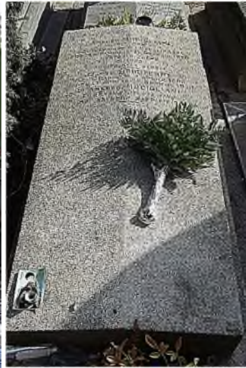
PL div. 96 - Modigliani