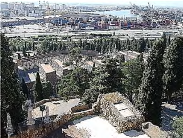
Barcelona-Montjuïc: 1091 joods - 1883 christelijk