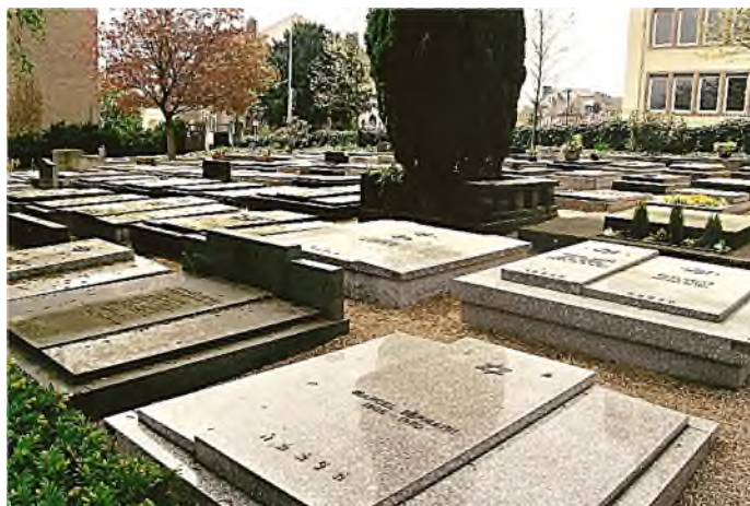
Ville de Luxembourg - Cimetière juif Bellevue oude deel: staande graftekens