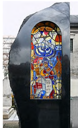
MP div. 5 - à la Chagall