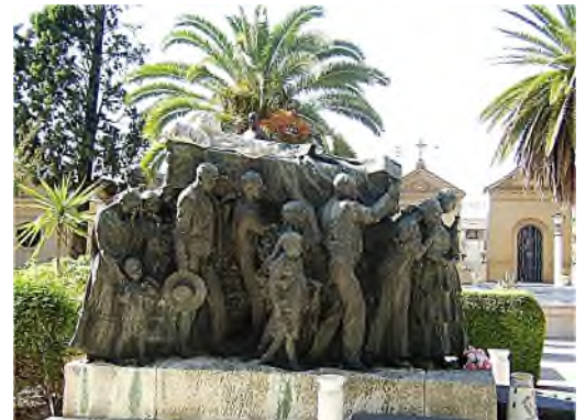
Sevilla - stierenvechter Joselito