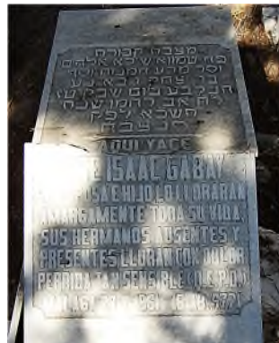
Malaga - English Cemetery