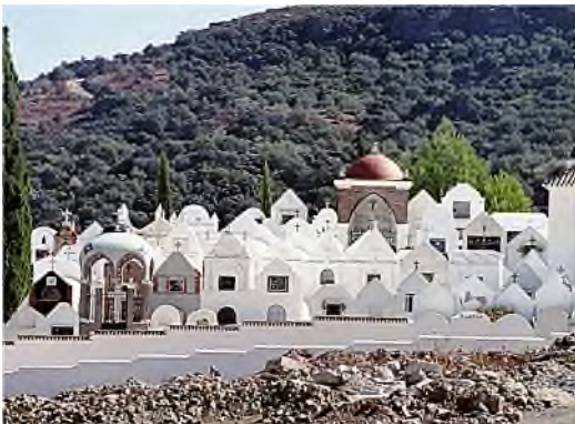
Casabermeja - wit dorpje

Soms kom je elders een joods grafteken tegen, bv. op het English Cemetery in Málaga uit 1829.