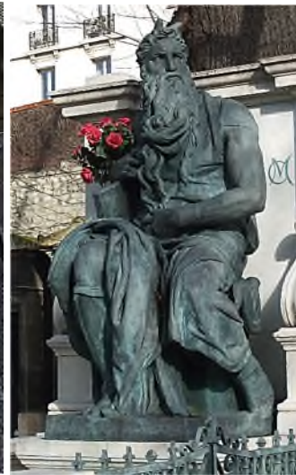
MM div. 3 - Osiris