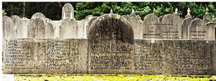
van Saint-Servais naar Putte

In België zijn geen joodse begraafplaatsen, maar wel joodse afdelingen op gemeentelijke begraafplaatsen. Vanwege het gelijkheidsbeginsel mogen er in België vanaf 1879 alleen maar gemeentelijke begraafplaatsen bestaan, met eventueel aparte percelen voor andere dan katholieke denominaties. Toen in 1971 ook nog eens het eeuwigdurend grafrecht, een voorwaarde voor joods begraven, werd afgeschaft, was dit voor religieuze joden helemaal reden zich in Nederland te laten begraven. Veel stoffelijke overschotten werden toen van joodse percelen overgebracht, al dan