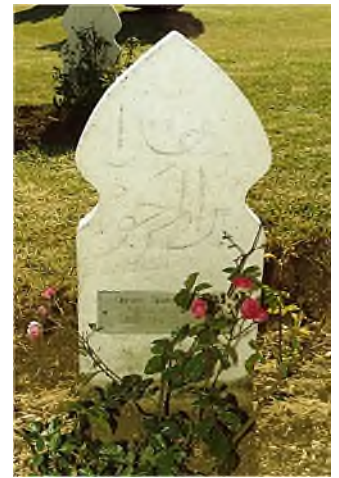
Verdun - Nécropole Nationale de Douaumont: 16.142 Franse militairen uit W.O. I (1914-1918)