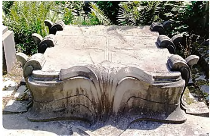
Dieweg - Ukkel: Isaac Stern (ontwerp Victor Horta)

In Antwerpen verwierven de joden in 1828 een perceel op de Kielbegraafplaats. Wegens plaatsgebrek werd in 1921 ter vervanging van Kiel begraafplaats Schoonselhof in gebruik genomen, waarna Kiel werd gesloten en geleidelijk aan ontruimd. In 1935 werden ca. 500 joodse stoffelijke resten overgebracht naar een ossuarium op begraafplaats Shomre Hadass in Putte. In 1948 werd een groot aantal graven en grafmonumen-