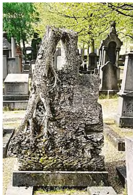
Ville de Luxembourg - Cimetière juif Bellevue