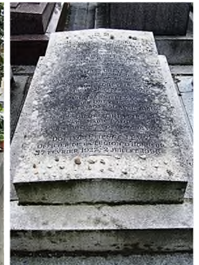
MP div. 29 - Dreyfus

Op Montparnasse zijn in meerdere divisies delen aangewezen als cimetière Israelite : 5, 25 en 30. Vooral in div. 5 vinden we een aantal joodse symbolen en een glas-in-loodraam à la Marc Chagall doet denken. De meest bekende joden liggen echter verspreid in andere divisies. Serge Gainsbourg, van wiens hijgerige liedje Je t'aime moi non plus 6 miljoen singeltjes werden ver-