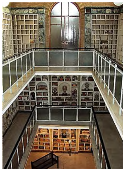
Golders Green Crematorium