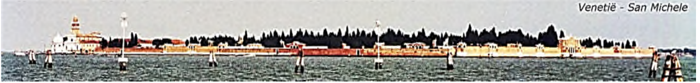
Venetië - San Michele

Het is de oudste nog in gebruik zijnde joodse begraafplaats in Italië. Het werd geopend in 1386, het jaar 5150 van de joodse kalender, en bleef zonder onderbreking in gebruik, zelfs nadat de joodse gemeenschap in 1516 werd gedwongen te leven in het getto. Het werd meer dan eens uitgebreid en bestaat nu uit twee delen, de oude begraafplaats (14 e - 18 e eeuw) en de nieuwe begraafplaats (19 e - 20 e eeuw). De uitvoering van de graftekens is een mix van Sefardisch, Asjkenazisch en Italiaans.