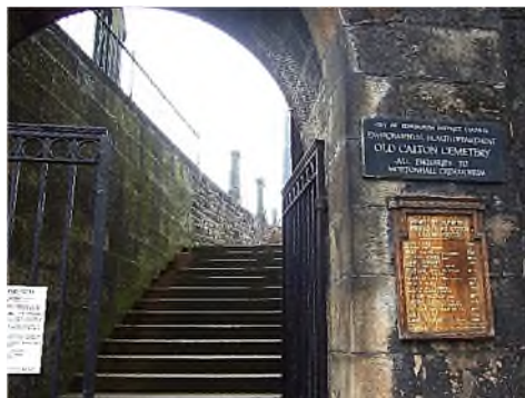
Edinburgh - Old Calton Cemetery

In Edinburgh werd de eerste joodse gemeenschap gevestigd in 1816. Er zijn 4 joodse begraafplaatsen in Edinburgh, waarvan er nog 2 in gebruik zijn, o.a. voor liberale joden op Dean Cemetery vanaf 2008. In Inverness was nooit een grote gemeenschap, op Tomnahurich Cemetery is een joodse deel van 23 graven, in gebruik van van 1906-2003.