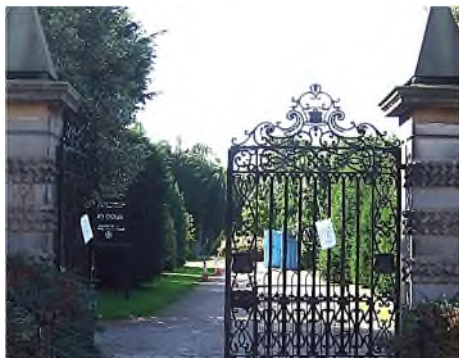
Edinburgh - Dean Cemetery