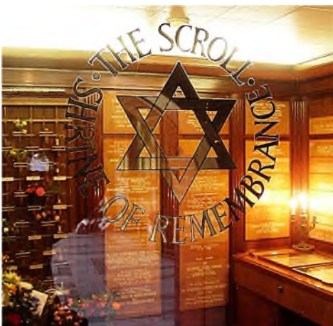
The Scroll. Shrine of Remembrance

namen en in de ruimte ligt het herinneringsboek. Onder de joden die zich hier lieten cremeren bevinden zich Sigmund Freud (1856-1939), zijn vrouw Martha Freud (1861-1951) en hun dochter Anna Freud (1895-1982). Omdat Freud van joodse afkomst was, moest hij in 1938 de wijk nemen naar Groot-Brittannië, waar hij met open armen werd ontvangen. Zijn as bevindt zich met die van zijn vrouw in een Griekse vaas, die op een marmeren sokkel staat in het Ernst George-columbarium. De urn was een geschenk van prinses Marie Bonaparte.