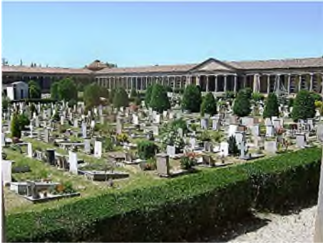
Cimitero di San Cataldo

Maar vergeten wordt dat er ook nog een derde deel is, namelijk het ommuurde Cimitero Ebraico. Het werd in gebruik genomen in 1903 ter vervanging van een oudere joodse begraafplaats uit 1631 aan de Via Pelusia. Van die begraafplaats werden grafstenen naar hier overgebracht. In Modena leefden zowel Sefardische als Azkenazische joden, op de begraafplaats zie je naast de traditionele vormgeving ook veel mengvormen, een liggende steen met een stèle aan het hoofdeind.