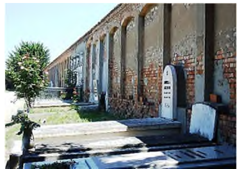
Modena - Cimitero Ebraico del Cimiteri San Cataldo