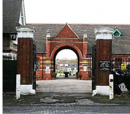
Hoop Lane Jewish Cemetery