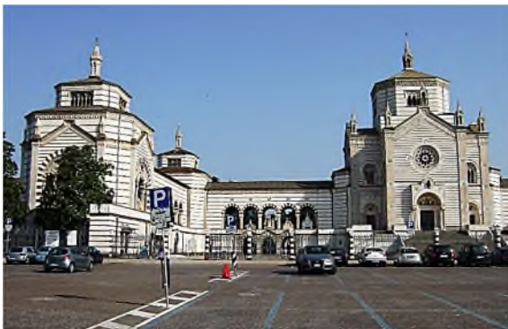
Milaan - Cimitero Il Monumentale

In 1597 werden de joden uitgewezen uit het hertogdom Milaan, dat van 1559-1701 een deel van het Spaanse Rijk was. Nu woont in Milaan een van de grootste populaties van joden. Er zijn twee joodse begraafplaatsen, die allebei een sectie zijn van respectievelijk het Cimitero Maggiore en het Cimitero Monumentale. De laatste ligt bij de hoofdingang helemaal rechts vooraan en