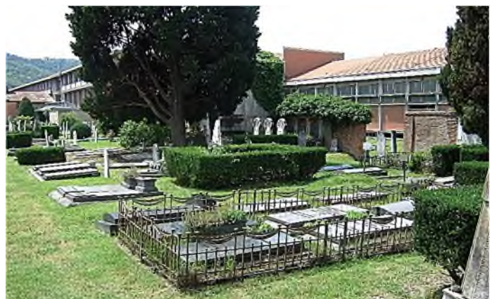
Bologna - Cimiterio Ebraico del Certosa