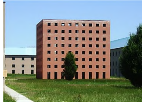
Cimitero Aldo Rossi