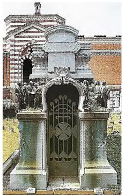
joods familiegraf Treves

Sterk contrasterend daarmee zijn de grote familiegraven; betere getuige van de assimilatie van de joden is er nauwelijks. Op de foto zijn achter het familiegraf Treves uit 1906 de kindergraven (paaltjes) te zien.