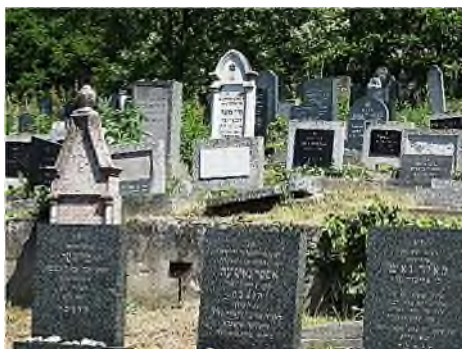
Židovský Cintorin Žižkova