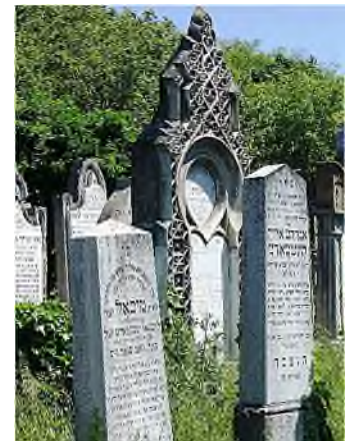
tot geassimileerd grafmonument in Praag - Warschau - Boedapest - Bratislava