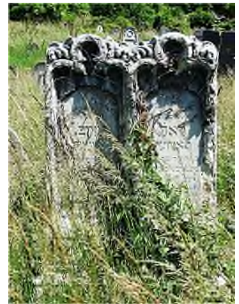
van eenvoudige matseva in Praag - Warschau - Boedapest - Bratislava