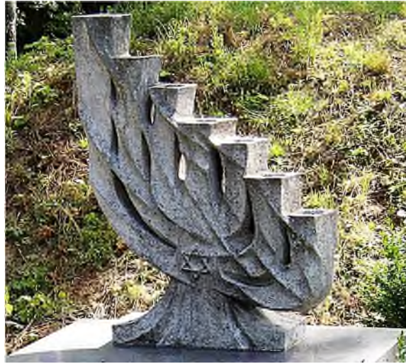
Warschau - Cmentarz Żydowski

Overall in Europa kom je joodse begraafplaatsen tegen. Het aanleggen van een begraafplaats was een eerste vereiste bij het oprichten van een joodse gemeente.