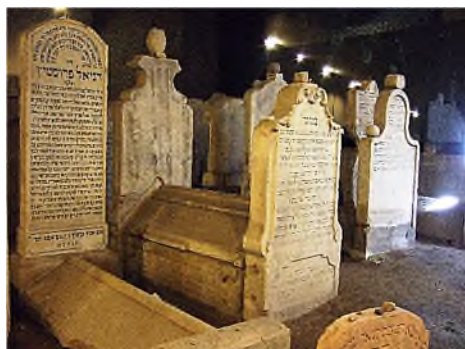
Pamätnik Chatama Sofera

Na de sluiting van de oude joodse begraafplaats werd niet veel verder aan de Žižkova-straat een nieuwe joodse begraafplaats aangelegd tegen een helling met uitzicht op de Donau. De begraafplaats is langgerekt met een groot aantal grafstenen, de meeste schots en scheef, het gras staat hoog en de padjes zijn smal.