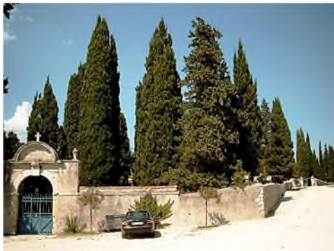
Barjac - cimetière

Lucien de Cock, auteur van Geschiedenis van de dood , stuurde daarover enkele foto's met het volgende bericht.