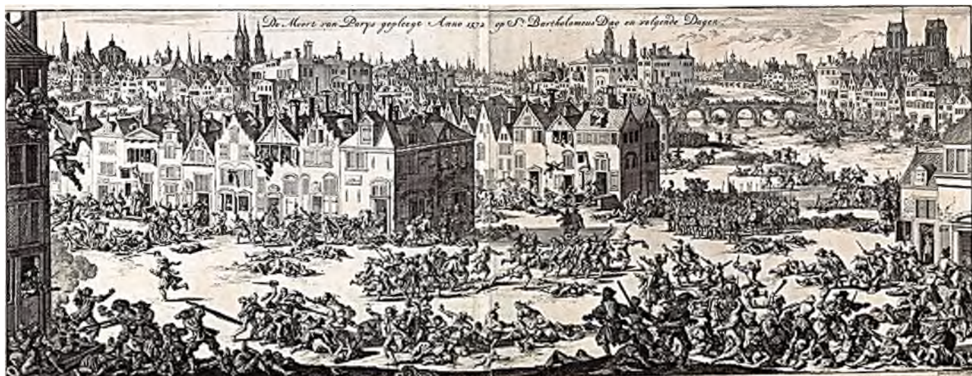
Jan & Caspar Luyken 'De Moort van Parys gepleegt Anno 1572 op St. Bartholomeus Dag en Volgende Dagen', kopergravure 1696