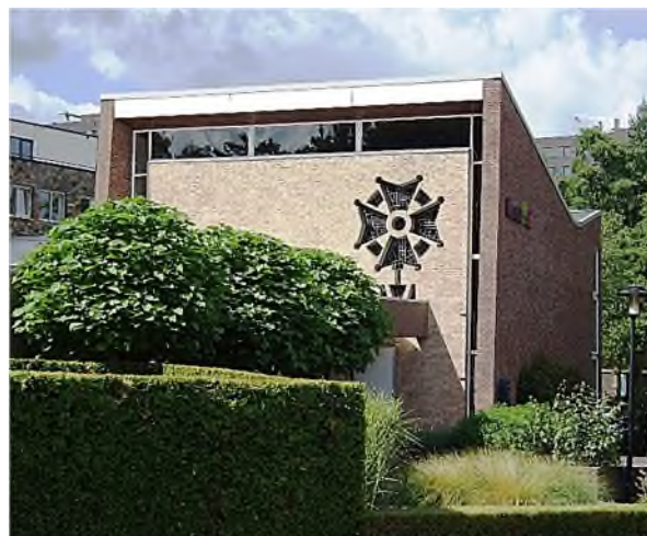
Eindhoven - voormalige Waalse kerk

In Nederland vestigde zich ook een groot aantal Hugenoten na hun vlucht uit Frankrijk. In de Republiek der Zeven Verenigde Nederlanden verenigden zij zich met de Waalse kerk , die eerder was opgericht voor de calvinistische vluchtelingen uit de (Spaanse, dus katholieke) Zuidelijke Nederlanden en waarbinnen de voertaal Frans was. In diverse steden ontstonden Waals-Franse gemeenten; zij waren onderdeel van de Nederlands Hervormde Kerk, nu PKN (Protestantse Kerk Nederland). Van de oorspronkelijke 80 Waalse kerken is door toenemende integratie van deze vluchtelingen in de Nederlandse samenleving het aantal Waalse gemeentes uiteindelijk gedaald tot veertien. En alhoewel zij niet de naam Hugenoten gebruikten, bleek uit het gebruik van het Hugenotenkruis wel degelijk hun oorsprong. Al is het in Eindhoven geen Waalse kerk meer, maar een uitvaartcentrum geworden, het symbool op/in het gebouw spreekt voor zich.