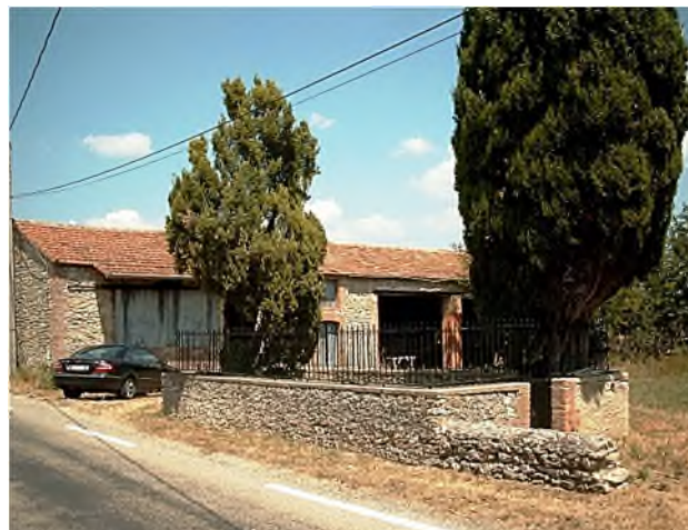
Courlas : begraafplaats in eigen tuin