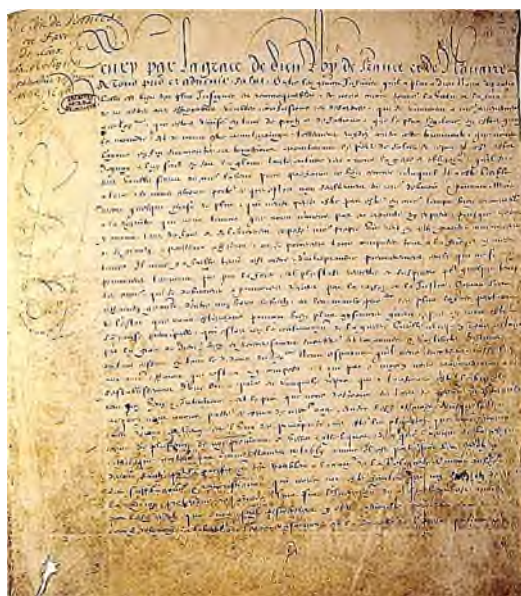
Edict van Nantes 1598

Toen in 1787 de opheffing van het Edict van Nantes weer ongedaan gemaakt werd, konden de overgebleven ondergedoken Hugenoten weer openlijk voor hun geloof uitkomen.