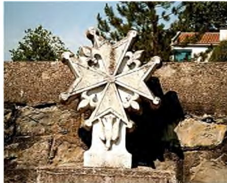
Saint-Ambroix : Hugenotenkruizen op graven