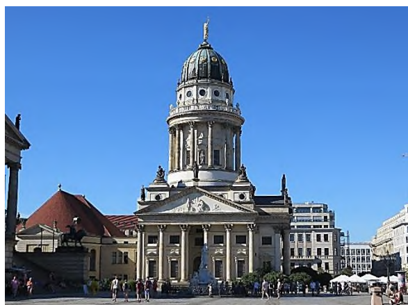
Berlijn - Französische Dom

In Duitsland vinden we ook veel sporen van Hugenoten terug. Op de Gendarmenmarkt in Berlijn staan aan weerszijden van het concertgebouw twee identieke koepelkerken. Rechts staat de Französische Dom, gebouwd tussen 1701 en 1705 voor de hugenoten (calvinisten) die Frankrijk ontvlucht waren en nog steeds zetel van de Gemeinde der Berliner Hugenotten . Links staat de Deutsche Dom, in 1708 gebouwd voor de protestanten (lutheranen).