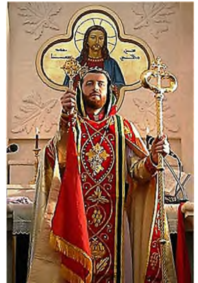
Mor Polycarpus Augin Aydin

De hoogste autoriteit van de Syrisch-Orthodoxe Kerk is de Patriarch, die gezien wordt als de rechtstreekse opvolger van Petrus op de bisschopszetel van Antiochië. Op 30 maart 2014 werd Mor Ignatius Aphrem II Karim (1965) gekozen als de 123 e opvolger van St. Petrus op de Apostolische Stoel van Antiochië.