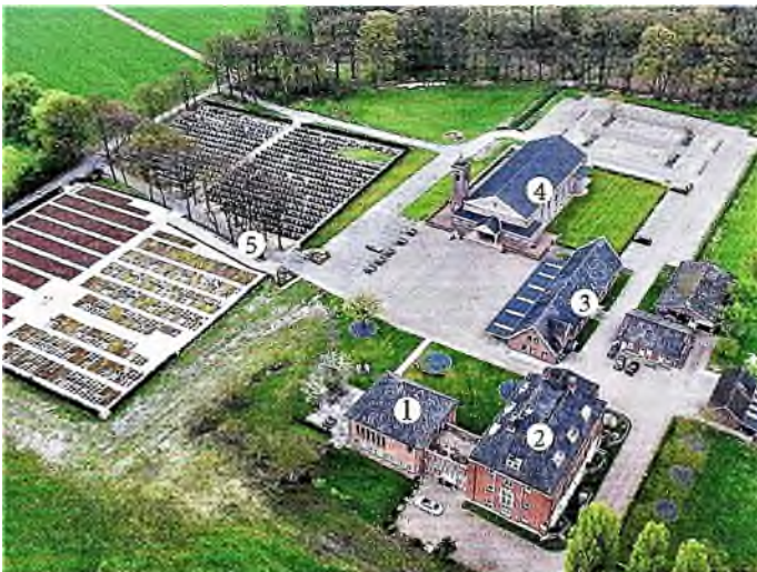
1. kapel - 2. klooster - 3. Dolabani-zaal 4. kathedraal + mausoleum - 5. begraafplaats