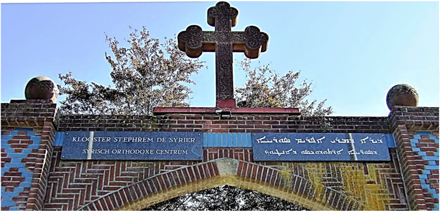
Glane - Klooster St. Ephrem de Syriër