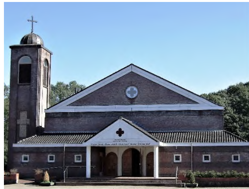
kathedraal H. Maagd Maria

gedelibereer en overleg met de gemeente een grote marmeren ruimte gebouwd, die als mausoleum dienst zou kunnen doen. En in de wet