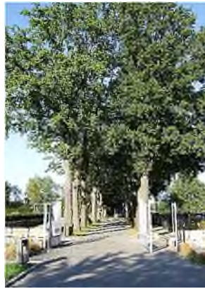
oude deel van de begraafplaats