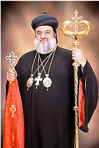
Ignatius Aphrem II Karim