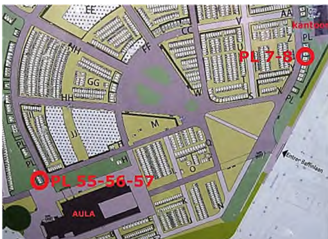
detail begraafplaats De Oude Toren