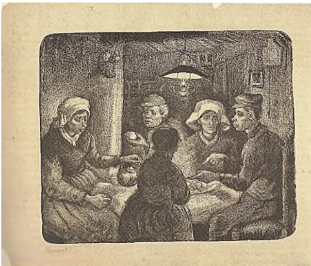
litho 'De Aardappeleters'