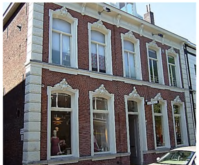
Kleine Berg 28 (anno 2017)