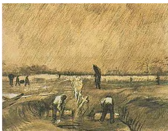
tekening JH 1032 / F 1399a