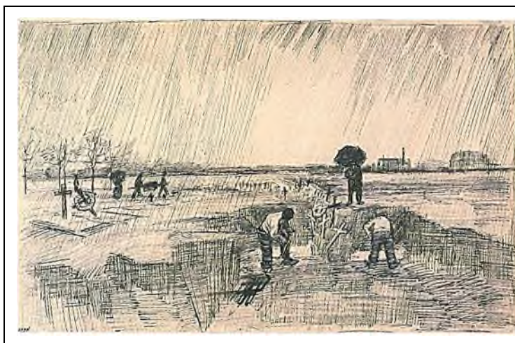
tekening JH 1031 / F 1399

Het betreft de volgende twee tekeningen: