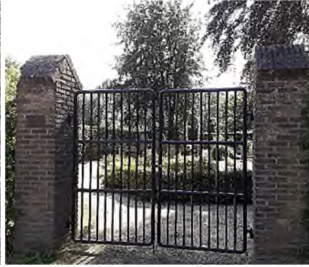
- ingang De Roosdoncken -