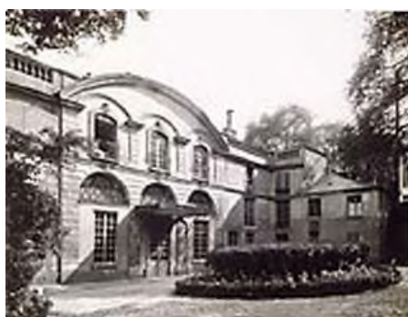
Kliniek Dr. Émile Blanche - Passy