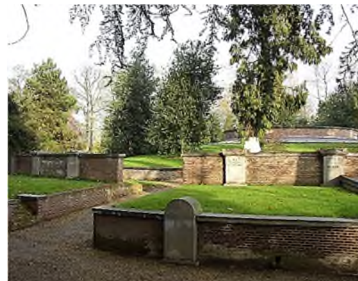
Soestbergen - 'Ring van Zocher'

Toen in 1829 het begraven in kerken en steden werd verboden en begraafplaatsen buiten de steden werden aangelegd, werd in 1830 naar ontwerp van landschapsarchitect J.D. Zocher jr. in Utrecht op het terrein van buitenplaats Soestbergen een algemene begraafplaats aangelegd in Engelse landschapsstijl. In het middengedeelte ligt de 'Ring van Zocher', een ronde grafheuvel, bezet met drie ringen met 170 gemetselde graf-ruimtes. Hier liggen de prominente burgers. Midden in de grafheuvel bevindt zich een open ronde put die bedoeld was als knekelput, maar die als zodanig nooit is gebruikt. Al wordt Soestbergen wel eens het Nederlandse Père Lachaise genoemd, er liggen weinig beroemdheden. Nicolaas Beets, Buys Ballot, W.G. van de Hulst en Gerrit Rietveld zijn de bekendste.