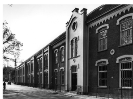
Willem Arntsz Huis - Utrecht