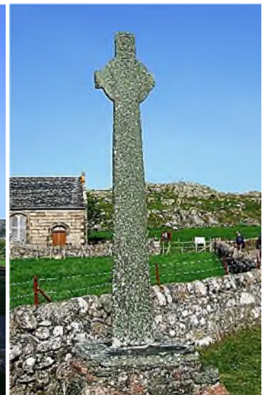
St. Martin's Cross (8 e eeuw)/St. John's Cross (museum) / St. John's Cross (replica) / MacLean's Cross (c.1500)