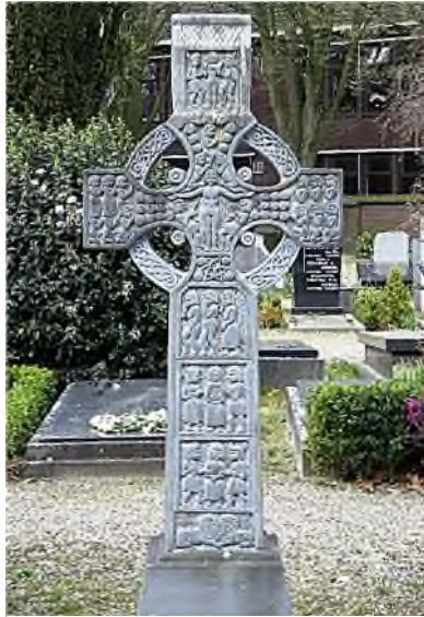
St. Catharinakerkhof - Eindhoven

In de van oorsprong Keltische wereld kom je dit soort kruizen geregeld tegen op begraafplaatsen. Al wordt vaak beweerd dat het Keltisch kruis door Ierse missionarissen werd geïntroduceerd in Schotland, Wales en bepaalde delen van Engeland, in werkelijkheid bestond het Keltisch kruis al eeuwen voor de komst van het christendom. Het is van origine een heidens symbool. In z'n oudste vorm had het kruis geen decoraties, de bovenste drie armen