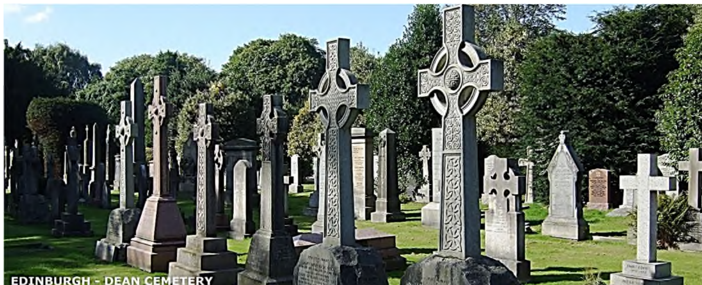
EDINBURGH - DEAN CEMETERY

Letten op de decoraties op het kruis, zijn er drie types te onderscheiden: kruisen met louter Keltische motieven, kruisen met Bijbelse motieven of kruisen met een combinatie van beide. Het motief van de Keltische knoop is bijna altijd terug te vinden: een lijnenspel zonder begin en einde, die staat voor de continuïteit, wat uitermate passend is bij het thema van leven en dood. Het Keltisch kruis werd ook geëxporteerd naar Amerika en het vasteland van Europa door afstammelingen van vooral Ierse emigranten.