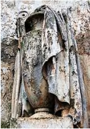
Glasgow - Necropolis

In de literatuur over de funeraire cultuur gaat het bij het symbool 'sluier' bijna uitsluitend over een gesluierde urn, een urn waaromheen een sluier is gedrapeerd. Het is een symbool uit de klassieke oudheid van de dood en de rouw en het symboliseert het afdekken of bedekken van het leven.