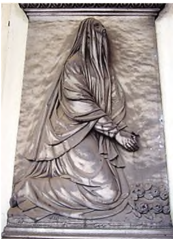
Genoa - Il Staglieno