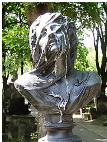
Warschau - Powązki