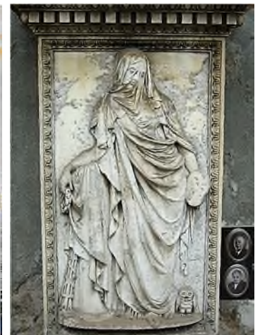
Turijn - Il Momumentale