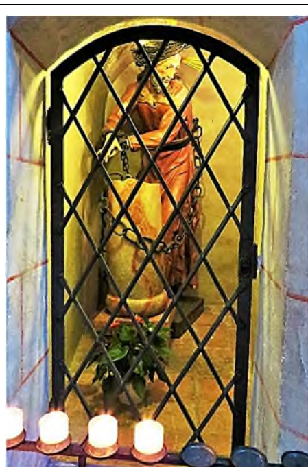
Augsburg: Domkirche St. Maria