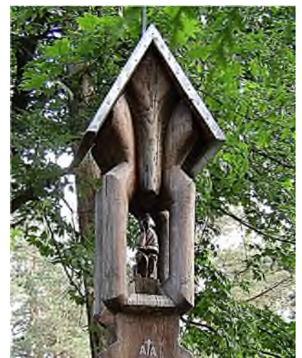
Vilnius - Saules kapinės