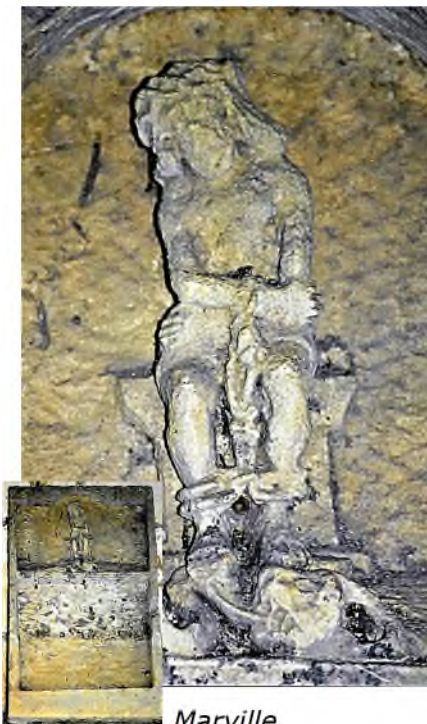
Marville Chapelle Saint-Hilaire

De graftekens uit de 18 de en 19 de eeuw, met als oudste een steen uit 1734, bleven buiten staan. Het thema Christ aux liens is in Marville op een aantal grafmonumenten terug te vinden, eenmaal op de begraafplaats, driemaal in de chapelle Saint-Hilaire en nog een keer op de epitaaf van Salantin de Gavroy († 1609) in de Église Saint-Nicolas in Marville zelf.