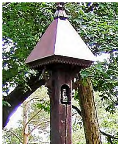
Vilnius - Saules kapinės