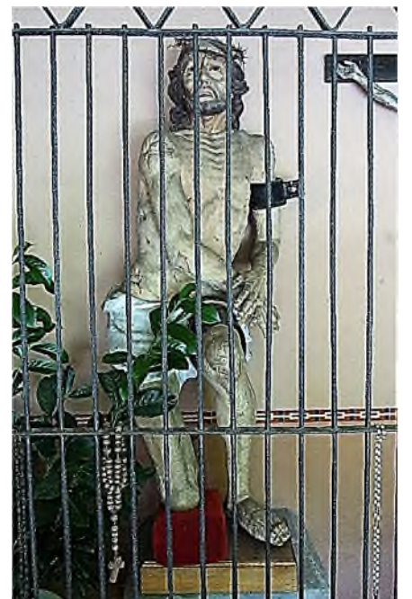
Meersburg - Friedhof