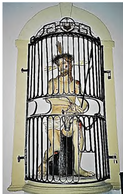
Salzburg - St. Sebastian