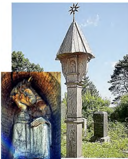
Vilnius - Rasų kapinės