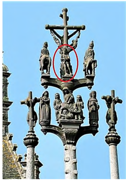
Saint-Thegonnec achterkant met Christ aux liens