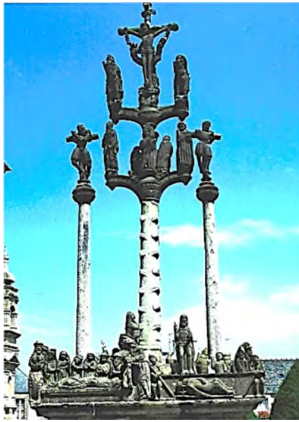
Saint-Thegonnec voorkant Calvaire