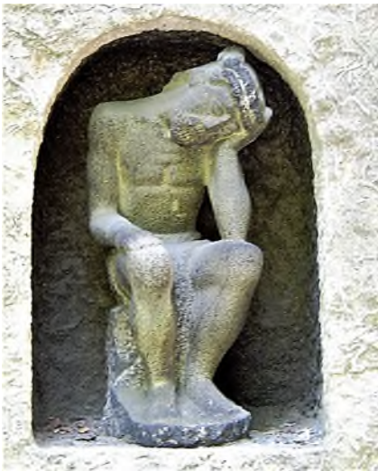
Warschau - Powązki Cmentarz