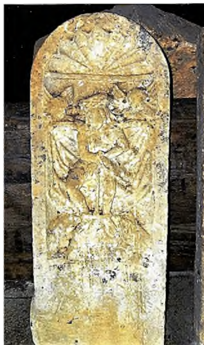
Marville Chapelle Saint-Hilaire