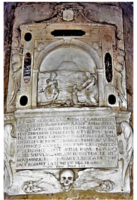
Marville Église Saint-Nicolas Salantin de Gavroy † 1609