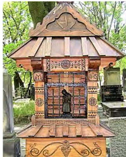
Warschau - Powązki Cmentarz