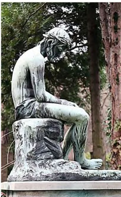
Dresden - Tolkewitz