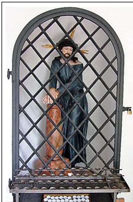
Augsburg: Kath. Hermanfriedhof