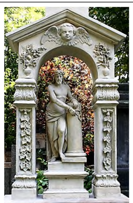
Warschau: Cmentarz Powązki