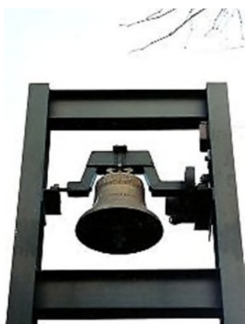
Den Haag-Petrus Banden