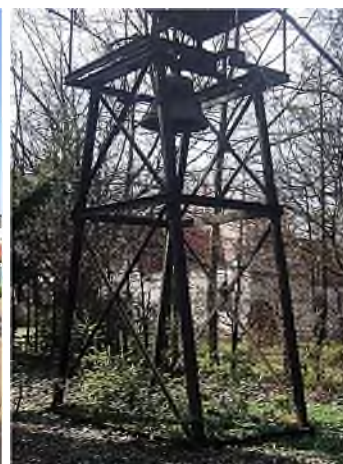
Mattäus - neu