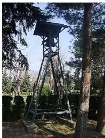
Katholisch - neu