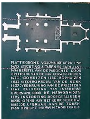
plattegrond voormalige kerk