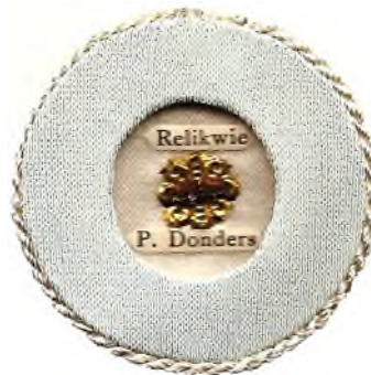
relikwie Peerke Donders