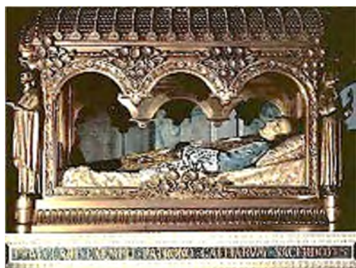
Ars-sur-Formans: pastoor van Ars

Maar over het algemeen zijn heiligen slechts zeer fragmentarisch bewaard gebleven.