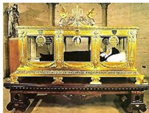
Nevers: Bernadette van Lourdes