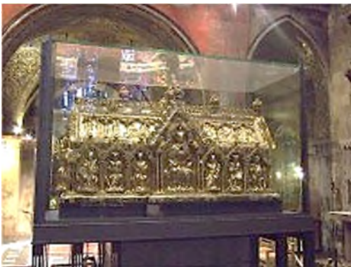
Aken - Dom 4 doekrelikwieën

De betekenis van relikwieën in het kerkelijke en wereldlijke leven was vooral een sociale. Het bezit van een relikwie van een heilige hield status en aanzien in. Relikwieën reisden in hun schrijnen met kerkelijke leiders mee als tekenen van hun ambt. Voor wereldlijke leiders had het bezit van relikwieën een bijzondere betekenis. Ze werden meegenomen als amulet bij een veldslag, er werden verdragen op afgesloten of ze deden dienst als diplomatieke gift. Ze legitimeerden het sacrale koningschap.