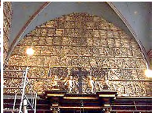
Keulen - Ursulakerk Ursula & 11.000 maagden