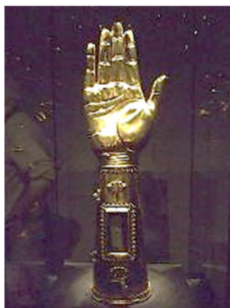
Keulen - armrelik