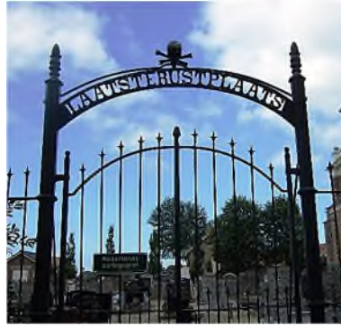
Urk - kerkhof aan zee

Dan zul je ontdekken, dat het 'lezen' van een begraafplaats niet eenvoudig is. Je moet rekening houden met