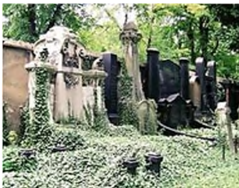
Praag: joodse assimilatie

Interessant is te zien hoe je de assimilatie van deze groep kunt volgen. Dat kan door naar de taal van het schrift op de grafsteen te kijken: alleen Hebreeuws, Hebreeuws en de landstaal, alleen de landstaal. Maar het is vooral het graftype, waarin zich de assimilatie uit. De eenvoudige matseva, de gebruikelijke stèle