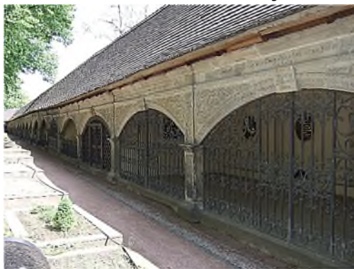
Halle (Saale): campo santo

Na en vanwege de afschaffing van de relikwieënverering tijdens de Reformatie vond er een decentralisatie plaats op de begraafplaats. Omdat de band tussen grafplaats en relieken niet meer nodig was, ontstond er een nieuwe structuur, waarin de sociaal hoogstaande grafplaatsen aan de periferie, langs de muur, werden aangelegd. De eenvoudige graven kwamen op