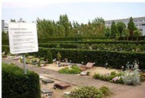
Den Haag: algemene graven

Er zijn nu twee mogelijkheden als grafkeuze. Algemene graven, die ongeacht de persoon die er begraven ligt wettelijk na 10 jaar geruimd mogen worden. En graven met uitsluitend recht, waar 20 jaar grafrechten op rusten,