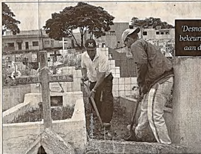
Inwoners van Biritiba-Mirim in Brazilië proberen op de overvolle begraafplaats toch nog een plekje te vinden voor een graf.

nodig. Het uit 1910 daterende kerkhof kan de twintig doden per maand niet meer bergen. De begraafplaats was berekend op 3500 stoffelijke resten. Intussen zijn er al 50.000 lijken 'weggestouwd'. Uitbreiding is echter onmo-