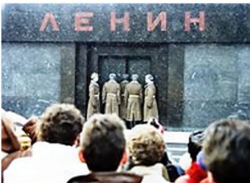
Londen - Jeremy Bentham

Een apart verhaal zijn de vele mummies, die onder kerken en in crypten zijn aangetroffen. Toen er nog in kerken werd begraven, d.w.z. onder de kerk, waren de klimatologische omstandigheden daar vaak zo gunstig dat er spontaan mummificatie plaatsvond: zeer droge lucht, een luchtstroom en geringe temperatuurswisselingen.