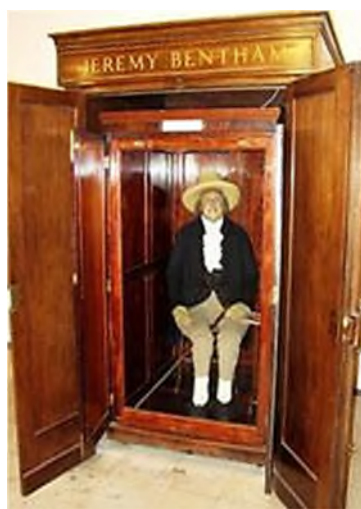
Moskou - Lenin