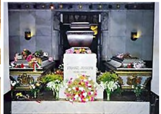
Wenen - Kaisergruft