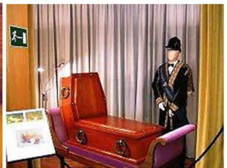
Bestattungsmuseum Wien zitkist