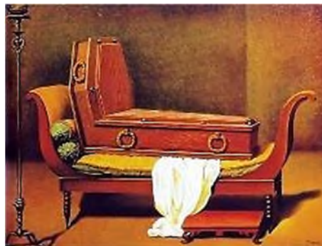
René Magritte Perspectives: Madame Récamier