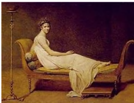
Jacques-Louis David Madame Récamier