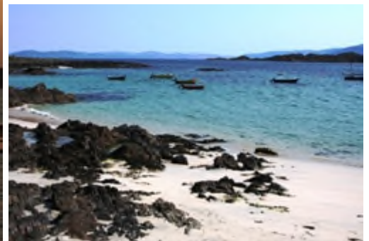
Atlantische Oceaan bij Schotland