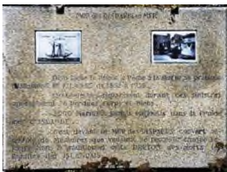
Ploubazlanec: mur des disparus en mer