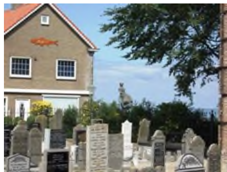
Urk: kerkhof aan de zee