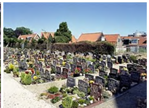
Volendam - glimmertjes