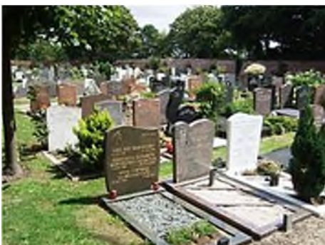
Noordwijk - golfjes

De uniformiteit deed zijn intrede. En die tendens naar uniformiteit uitte zich niet alleen in 'iedereen in een spijkerbroek' en 'iedereen naar een hamburgertent', maar ook 'iedereen onder dezelfde grafsteen'. Het is de wereld van Levi, Ikea, McDonald en McDeath. De uitvaart business ging floreren. Steenhouwer bedrijven zorgden voor de aankleding van de begraafplaats. Aanvankelijk waren het ambachtslieden, die vakwerk leverden. Vanaf de zeventiger jaren van de vorige eeuw werden massaproducten geïmporteerd, die door liefhebbers van funeraire cultuur vanwege de vaak golvende bovenrand als 'golfjes' en vanwege de spiegelgladde polijsting als 'glimmertjes' worden afgedaan. Het waren vooral de begraafplaatsverordeningen, die strikt gingen voorschrijven aan welke eisen het grafteken en/of de grafbedekking moest voldoen: 90 cm hoog, 60 cm breed, 10 cm dik.