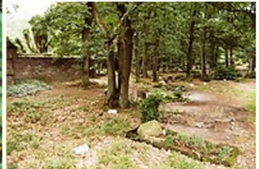
Asselt - eerste natuurbegraafplaats in Nederland