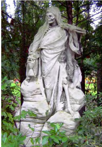
Keulen - Melatenfriedhof

kunnen behoudenswaardige monumenten waarvan de grafrechten zijn verlopen sinds 1990 geadopteerd en hergebruikt worden. Het grafrecht is gratis, maar er is wel de verplichting het monument te restaureren en zo te behouden. Tot 2012 hebben ongeveer 400 monumenten zo een nieuwe bestemming gevonden. Veel andere begraafplaatsen in Duitse steden volgden en volgen bovengenoemde voorbeelden.