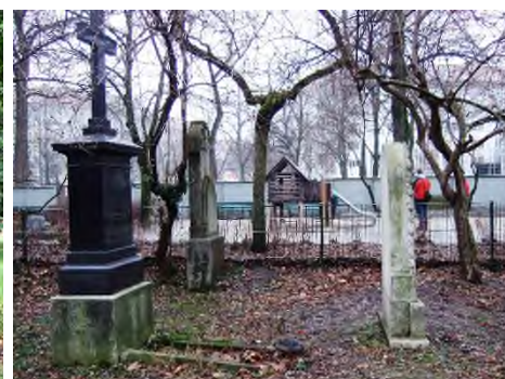
München - Alter Nordfriedhof