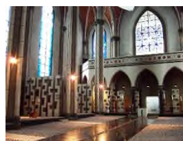
Aken Grabeskirche St. Josef