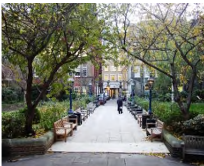
Covent Garden - St. Paul's

En zo komt het dat je op de meest onverwachte plaatsen in Londen voormalige begraafplaatsen tegenkomt. Je kunt een krantje lezen op een van de bankjes op het St. Paul's Churchyard bij Covent Garden . Of je kunt koffie drinken op de grafzerken in het Café in the Crypt van de St. Martin-in-the-Fields Church bij Trafalgar Square. Bunhill Fields (1665-1853) is de enige begraafplaats, die in zijn geheel is overgebleven uit de tijd dat in het centrum van de stad werd begraven. Het is een populaire lunchplaats voor het kantoorpersoneel uit de directe omgeving.