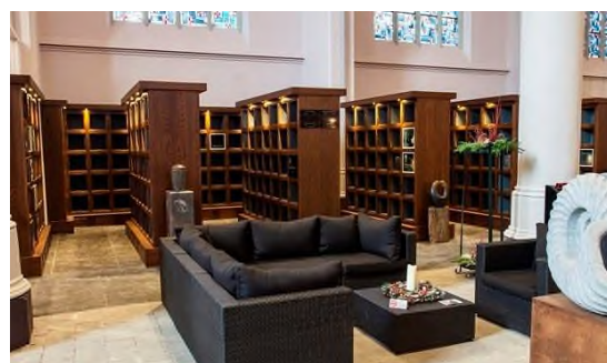
Arnhem - Memorarium