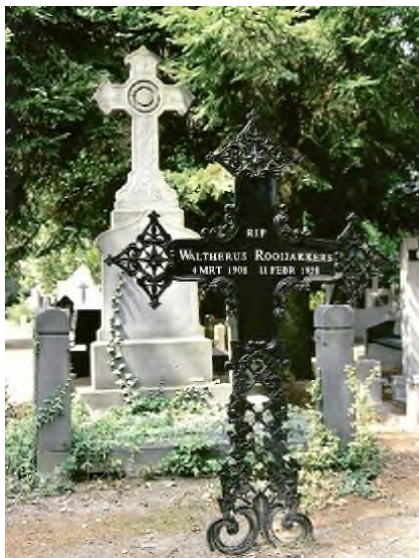
Budel - O.L.Vrouwe Presentatie

horende graf overnemen en hergebruiken. Dat kost voor twee plaatsen € 800,- voor een zandgraf en € 1600,- voor een keldergraf. Na aanvraag en betaling wordt het graf geruimd; op dat moment gaat ook de termijn van 50 jaar in. Hoe langer je nog leeft, hoe korter je van je laatste rustplaats kunt 'genieten'. Je kunt ook een optie op het graf nemen, die pas ingaat bij overlijden.