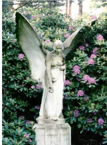
Hamburg - Friedhof Ohlsdorf