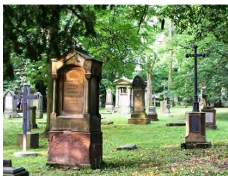
Stuttgart - Hoppenlaufriedhof