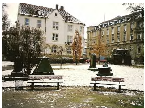
Kassel - Altstädter Friedhof

stad als wandelpark, ze zijn een oase van rust in de hectiek van het stadsleven en fungeren als groene long. Enkele voorbeelden: het Alter Golzheimer Friedhof (1804-1884) in Düsseldorf, het Altstädter Friedhof (1533-1843) in Kassel, het Hoppenlaufriedhof (1626) in Stuttgart.