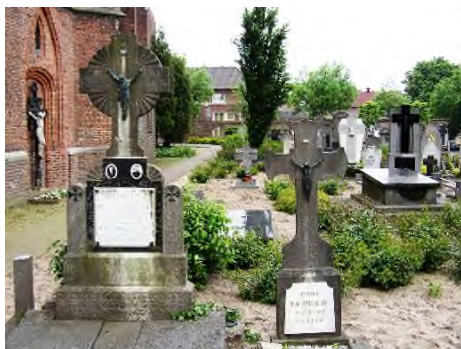
Deurne - St. Willibrorduskerkhof