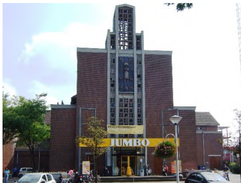
Helmond - Sint Bernadettekerk

In DUITSLAND vinden we daarvan al diverse voorbeelden.