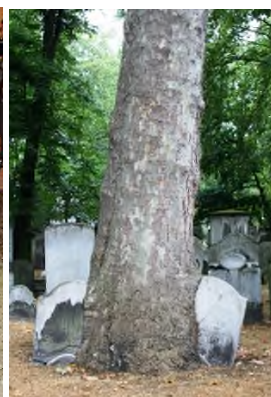
Bunhill Fields Cemetery