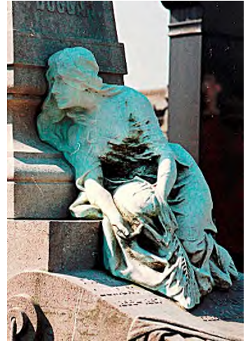
Antwerpen - Schoonselhof

In BELGIË kun je op een aantal begraafplaatsen in Vlaamse steden (Antwerpen, Gent, Brugge, Mechelen) voor een luttel bedrag voor een periode van 50 jaar het Peterschap (adoptie) van een grafmonument verwerven onder voorwaarde dat je het restaureert en onderhoudt. Op begraafplaats Schoonselhof in Antwerpen kost een adoptie € 5,00. Sinds kort kun je ook het bijbe-