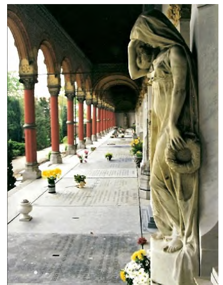
Den Haag - St. Petrus Banden

In NEDERLAND kwam in 1995 een begraafplaats in Veghel in het nieuws toen deze geruimde grafkelders weer beschikbaar stelde onder voorwaarde dat de nieuwe eigenaar het bijbehorende historische monument adopteerde en restaureerde. Velen reageerden geschokt en afwijzend en beschouwden het ethisch als 'not done'. Inmiddels is het taboe wat minder geworden en worden graftekens opnieuw gebruikt. Er zijn twee mogelijkheden: of men adopteert alleen het grafteken of men hergebruikt grafteken en graf. In Budel zit op sommige graftekens een tekstplaatje 'heemkundekring'. Het gaat daarbij om graven die sinds 1995 door de heemkundekring zijn geadopteerd, gerestaureerd en betaald. Er wordt