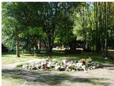
Metz - Cimetière de l'Est