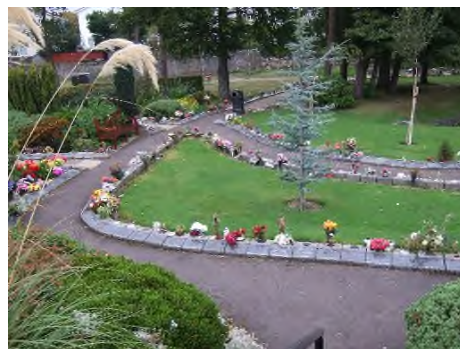
Edinburgh - Mortonhall Crematorium