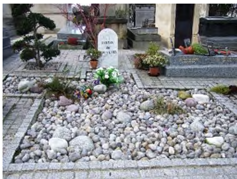
Parisi - Cimetière de Montmartre

heden op begraafplaatsen legio, zelfs op gesloten begraafplaatsen. Maar een Franse jardin du souvenir , een 'tuintje' speciaal ontworpen voor asverstrooiing) of herdenkingsstenen op een Schotse Memorial Walkway zie je hier nog niet. In thema 43 (Hondengraven 2) heb ik het idee geopperd om op begraafplaatsen, waar (weer) ruimte over is nu er minder begraven en meer gecremeerd wordt, ongebruikte velden te gaan hergebruiken als dierenbegraafplaats. Wettelijk is daar niets op tegen, volgens het Ministerie van Binnenlandse Zaken en Koninkrijksrelaties, die hier over gaat.