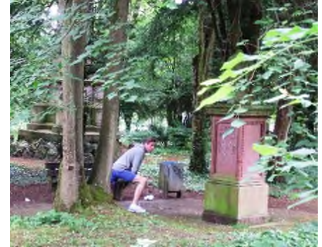
Wiesbaden - Freizeitpark Alter Friedhof

In GROOT-BRITANNIË hoeft men zich niet in te zetten voor het behoud van begraafplaatsen, want daar is het wettelijk niet toegestaan begraafplaatsen en graven te ruimen of te hergebruiken. Omdat Napoleon Groot-Brittannië nooit heeft veroverd zijn daar ook nooit de Napoleonische wetten ingevoerd, waarin o.a. ruiming en hergebruik van graven werd geregeld.