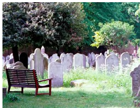
Londen - Brompton Cemetery