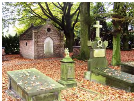
Valkenswaard - Oude Begraafplaats