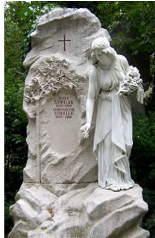
Würzburg - Hauptfriedhof