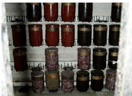
Ootmarsum - HH. Simon & Judaskerk

In de Amsterdamse St. Augustinuskerk komt het tweede Memorarium, waar urnen kunnen worden bijgezet en waar uitvaarten en herdenkingsdiensten kunnen worden gehouden.