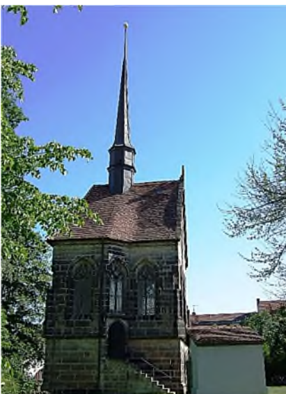
kruiskapel met 2 etages

De grafkapel is in verkleinde vorm een getrouwe nabootsing van het Heilig Graf in Jeruzalem, zoals deze er 500 jaar geleden uitzag. Daar werd de kapel in het begin van de 19 e eeuw na een brand in Grieks-orthodoxe stijl herbouwd. De kapel bestaat uit een voorkamer, waarin een 'engel' staat, en een (lege) grafkamer met een 1,92 m lange steenbank.