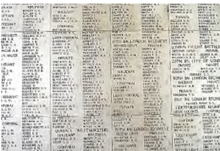
Ieder - Menendoort

De Cenotaph van Sir Edwin Luyens lijkt nog op een (uitvergroete) grafsteen en er staan geen namen op. Dat geldt niet voor andere oorlogsmonumenten, waarop de namen zijn geschreven van de vermiste militairen, die geen graf hebben gekregen. Voor hen geldt het monument als grafgedenksteen.