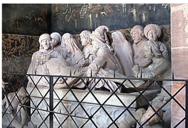
Nürnberg - graflegging van Adam Kraft (1508) in de Holzschuherkapelle