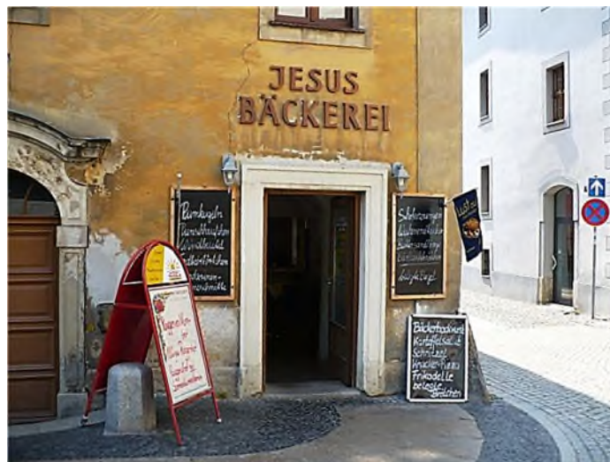
op pelgrimstocht in Görlitz