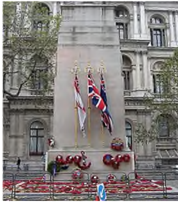
London - The Cenotaph

Er zijn graven zonder grafteken, maar er zijn ook graftekens zonder graf: schijngraven. Een grafteken is de algemene aanduiding voor iedere vorm van een materieel herinneringsteken, dat (meestal) op een individueel graf staat of ligt. Het woord grafmonument wordt ook vaak gebruikt, maar zoals het woord het al zegt, gaat dat grafteken meer de monumentale kant op.