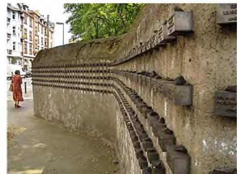
Frankfurt - joodse begraafplaats Battonstrasse