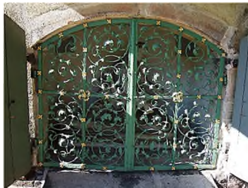
zalfhuis met Piëta