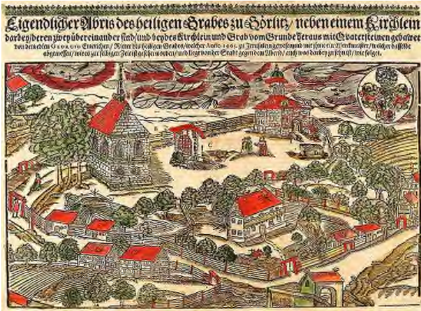
illustratie uit ca. 1700 van het complex

Het 'Heilig Graf' in Görlitz ontstond tussen 1481 en 1504 als een totaalkunstwerk en strekte zich uit over een groot deel van de stad. Het hele lijdensverhaal van Christus is hier nog deels topografisch terug te vinden. Het hele complex bestaat uit een drietal gebouwtjes, een 'bijbels' landschap en de via dolorosa , de kruisweg van Jezus. Het geheel geldt als een eerste poging tot landschapsarchitectuur in Europa.