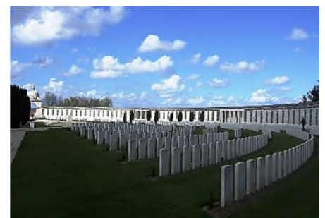
Tyne Cot Cemeterij

Denk aan de Menendoort in Ieper, waarop de namen van 54.896 vermiste soldaten staan. Nog iedere avond wordt hier nog de Last Post geblazen ter nagedachtenis van de gesneuvelde soldaten. Omdat de Menendoort te klein bleek te zijn, werden alle Britse vermisten, gesneuveld vanaf 16 augustus 1917, vermeld op het Tyne Cot Memorial , dat op het Tyne Cot Cemetery in Passendale staat. Daarop staan de namen van nog eens 34.959 vermisten.