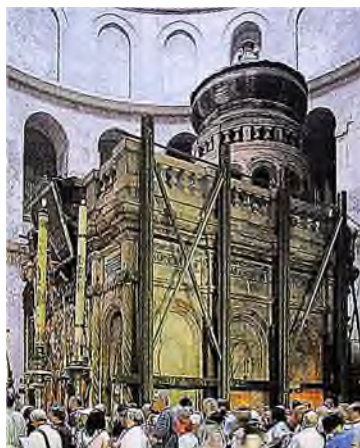
Jeruzalem - Heilig Graf

In Duitsland zijn nog 17 heiliggrafkapellen. Op het Sankt Johannisfriedhof in Nürnberg staat de Holzschuherkapelle , gebouwd in 1507 naar het voorbeeld van de Heilig Grafkerk in Jeruzalem. Het werd in 1523 de begraafplaats van het patriciërsgezicht Holzschuher. In het interieur bevindt zich een nis waarin de graflegging van Christus staat, het laatste kunstwerk dat beeldhouwer Adam Kraft in 1508 schiep. De mooiste nabootsing van het Heilig Graf vinden we in Görlitz.