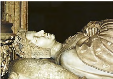
bovenste etage: levend

Het Monastère royal de Brou in Bourg-en-Bresse , dat nu ook tegelijk grafkerk en museum is, werd gesticht door Margaretha van Oostenrijk (1480-1530), bekend als landvoogdes van de Nederlanden, ter ere van haar jonggestorven echtgenoot Philibert le Beau (1480-1504). Na haar dood werd ook zij in het klooster bijgezet. In de kerk staan twee laatgotische meesterwerken van Conrad Meyt, het zijn de cenotafen voor Margaretha en Philibert. Het zijn grafmonumenten in twee etages: bovenop is de persoon levend afgebeeld, gekleed in ambtsgewaad, beneden is de overledene dood afgebeeld, gekleed in doodshemd.