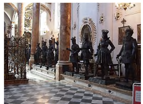
Innsbruck - Hofkirche: cenotaaf Maximilian I

Volgende keer in deel 5 van Schijngraven: