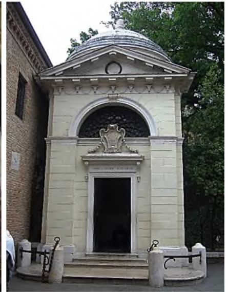
Ravenna - tomba di Dante

• Het Panthéon in Parijs was afwisselend kerk en tempel voor de groten van Frankrijk tot het in 1885 definitief Panthéon werd Aux grandes hommes la patrie reconnaissante . Veel groten werden van hun oorspronkelijke plaats overgebracht naar het Panthéon en lieten een cenotaaf achter (daarover de volgende keer). Dat gold ook voor Jean-Jacques Rousseau (1712-1778). Als een van de eersten liet hij zich buiten de stad begraven in zijn geliefde natuur, op het eilandje Les Peupliers in Ermenonville, maar werd in 1794 overgebracht naar het Panthéon. Zijn tombe op het eilandje werd een cenotaaf, in het Panthéon staat in de crypte de sarcofaag met zijn stoffelijke resten, maar in de bovenkerk werd in 1912 door Albert Bartholomé (maker van het Monument aux Morts op Père Lachaise) voor hem een cenotaaf geplaatst.