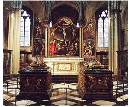
Brugge - Onze-Lieve-Vrouwekerk: Maria van Bourgondië en Karel de Stoute