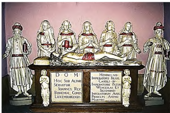
Luxemburg - Notre Dame: Jan de Blinde