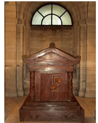
Panthéon: sarcofaag van Jean-Jacques Rousseau

• In het Vaticaan liggen de praalgraven van de pausen in het zicht, terwijl de pausen zelf uit het zicht en dieper zijn bijgezet. • Kathedralen zijn de zetels van aartsbisschoppen en kardinalen, die daarin ook hun laatste rustplaats vonden/vinden in een bisschoppelijke grafkelder. Ter herinnering aan hen werd in de kathedraal vaak een cenotaaf geplaatst met hun beeltenis. Hieronder enkele willekeurige voorbeelden.