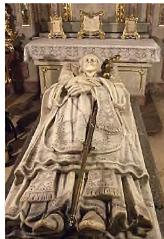
Augsburg - St. Ulrich & Afra