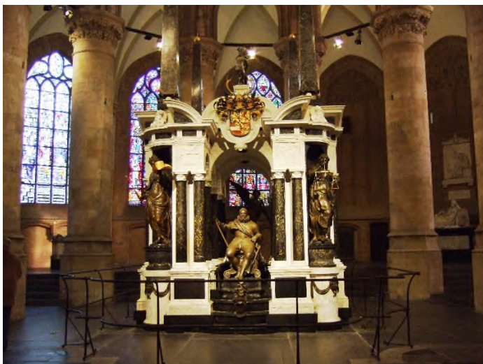
Delft: Willem van Oranje

Achter in de Dom-zu-Unserer-Lieben-Frau ofwel kortweg Frauenkirche in München staat de enorme bronzen cenotaaf voor keizer Ludwig IV der Bayer (1282-1347), in 1622 vervaardigd door Hans Krumper. Keizer Ludwig IV werd na zijn dood bijgezet bij zijn eerste vrouw Beatrix von Glogau (†1322) in de voorganger van deze kerk en in 1468 samen met zijn vrouw herbegraven in de nieuwe Dom.