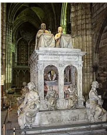
Louis XII & Anne de Bretagne

Cenotafen worden vaak de grootse grafmonumenten genoemd voor keizers, koningen en leden van de adellijke of geestelijke stand. De monumenten werden opgesteld in kerken en kloosters, terwijl de doden elders in grafkelders werden bijgezet. Eigenlijk zijn het oneigenlijke cenotafen, maar omdat ze geen lichaam herbergen, dus leeg zijn, vallen ze in de categorie cenotaaf. Daarvan zijn er voorbeelden te over.