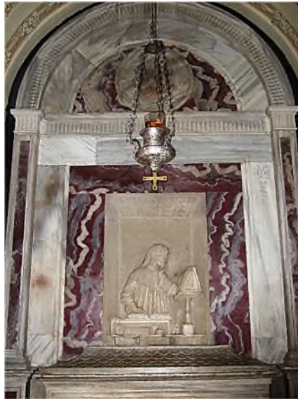
Ravenna - interieur