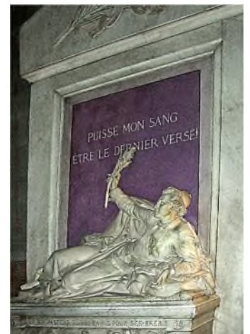
Parijs - Notre Dame