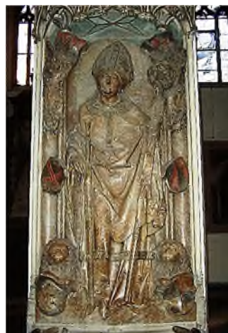
Würzburg - Kiliansdom