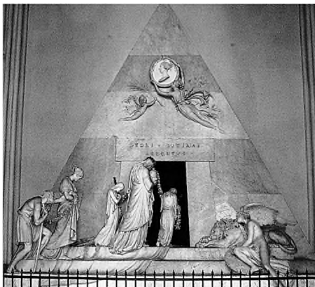
Wenen - Augustinerkirche: Maria Christina

worden gevolgd door de Liefdadigheid met een grijsaard aan haar arm. Zelfs de dierenwereld treurt, gesymboliseerd door een liggende koninklijke leeuw met het Saksische wapenschild van zijn meesteres. Op hem steunt een gevleugelde genius. Boven de ingang zweeft de Gelukzaligheid met een medaillon van de overledene en de tekst Uxor optimae Albertus (de beste echtgenote van Albert) met daaromheen een ouroboros (staartbijtende slang) als symbool van de eeuwigheid. Een genius reikt Maria Christina een palmtak aan. Maria Christina is zelf bijgezet in de Kaisergruf in de Kapuzinerkirche.