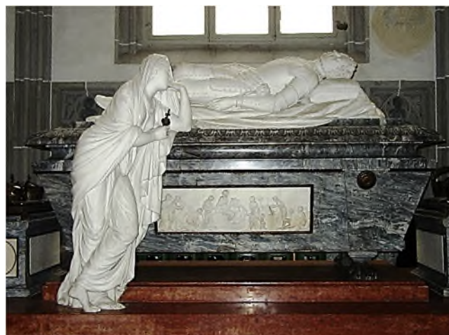
Wenen - Augustinerkirche: Leopold II