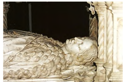
onderste etage: dood

Het praalgraf van Willem van Oranje (1533-1584) in de Nieuwe Kerk in Delft , dat boven de grafkelder van Oranje Nassau staat, is in feite ook een cenotaaf, hoewel er een kistje in zit met waarschijnlijk de ingewanden van Willem van Oranje. Het monument werd ontworpen en vervaardigd door Hendrik de Keyser vanaf 1614 en na zijn dood in 1621 voltooid door zijn zoon in 1623.