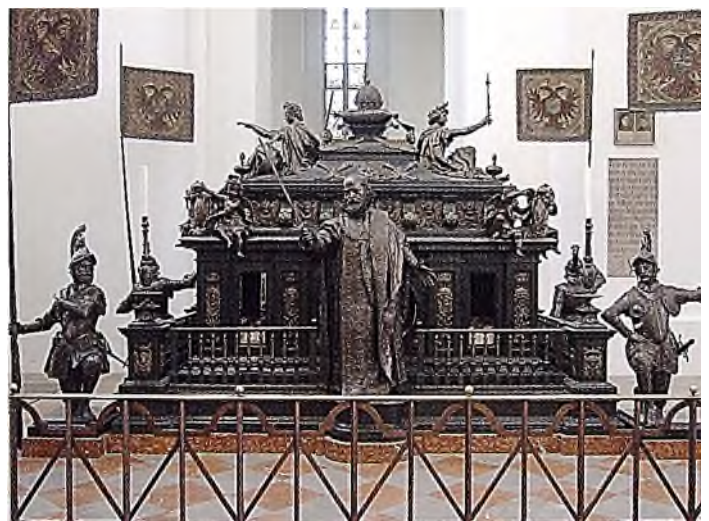
München: Kaiser Ludwig der Bayer

Het kan ook voorkomen dat een persoon twee grafmonumenten in kerken heeft gekregen, waarvan de ene een cenotaaf is en de andere het echte graf. Dat geldt bijvoorbeeld voor Dante Alighieri (1265-1321): een cenotaaf in de Basilica Sante Croce in Florence , een graftombe in Ravenna . Dante, geboren in Florence, werd om politieke redenen verbannen uit de stad. Hij stierf in 1321 als balling in Ravenna, waar hij begraven ligt in een eigen grafkapel naast de Basilica di San Francesco.