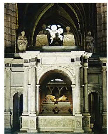
François I & Claude de France