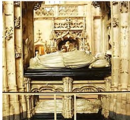
Margaretha van Oostenrijk