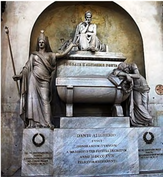
Florence - Santa Croce: cenotaaf

Lange tijd bestond er twist tussen Florence en Ravenna om zijn lijk, maar Dante blijft voorlopig in Ravenna. In Florence is nog altijd een cenotaaf van hem te bezichtigen in de Santa Croce. Het Florentijnse gemeentebestuur zendt sinds 1325 jaarlijks een kruik met olijfolie en een palmtak naar Ravenna met het verzoek om de stoffelijke resten van 'Onze Grootste Zoon' terug te geven 'opdat de beenderen een rechtmatige plaats krijgen'. De magistraten van Ravenna blijven, zelfs in tijden van koninklijke, keizerlijke, mussoliniaanse, berlusconiaanse, pauselijke en wereldoorlogen, correct en beleefd: 'Eens verbanen, blijft verbannen'.