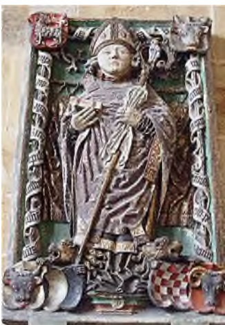
Meissen - Dom

• In het Vaticaan liggen de praalgraven van de pausen in het zicht, terwijl de pausen zelf uit het zicht en dieper zijn bijgezet. • Kathedralen zijn de zetels van aartsbisschoppen en kardinalen, die daarin ook hun laatste rustplaats vonden/vinden in een bisschoppelijke grafkelder. Ter herinnering aan hen werd in de kathedraal vaak een cenotaaf geplaatst met hun beeltenis. Hieronder enkele willekeurige voorbeelden.